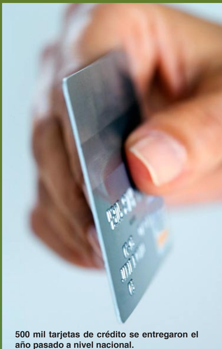
500 mil tarjetas de crédito se entregaron el año pasado a nivel nacional.

Entre las entidades afiliadas a la DCF están: BBVA Banco Continental, Banco de Crédito BCP, CrediScotia, Banco Financiero, Banco Interamericano de Finanzas (BIF), Scotiabank Perú, Banco Falabella, Banco Ripley, Interbank, Mibanco, Citibank del Perú, HSBC Bank Peru y Financiera TFC.