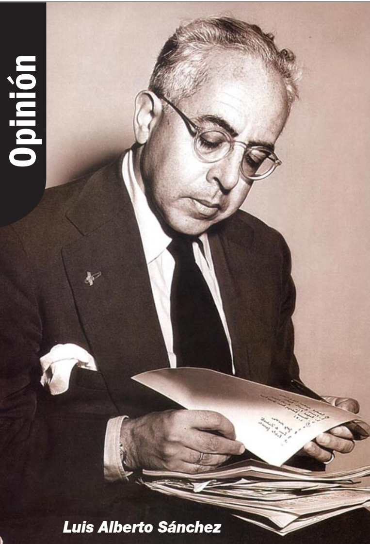
Luis Alberto Sánchez