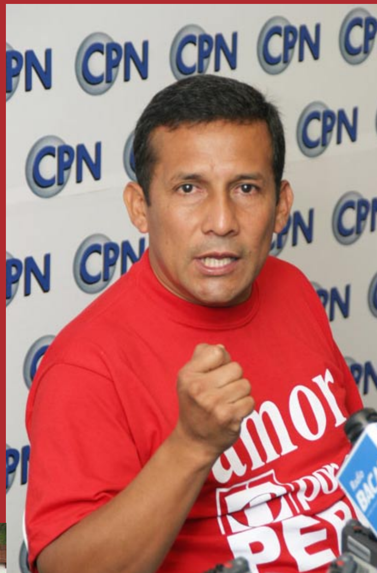
"Aunque estoy convencido de que Ollanta no ganará, temo que Keiko sí lo haga."