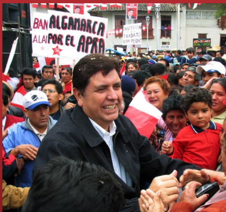
• "En la campaña del 2001, García se comprometió a entregarle a la juventud el canal del Estado para que hiciera programas culturales y artísticos. Nada de eso sucedió."

Burdel narra la historia de dos jóvenes abogados que participaron en las marchas contra Fujimori, los años 99 y 2000. Una vez caído el régimen, ambos intentan hacer política y en el camino recorren el lado oscuro de los partidos, el canibalismo de las cúpulas y de los grupos de poder, entre otras cosas. En un momento de la historia, Rodrigo, uno de ellos, se convierte en emo, esos chicos de aspecto triste. Esteban, el otro, se transforma en un sujeto oportunista y frío, a quien poco le importa lo que suceda con el país. Se trata de dos víctimas de nuestra sociedad. La historia es narrada por Máximo Vitale, amigo de ambos y personaje principal de "Asesino", la novela que en este momento sigo corrigiendo.