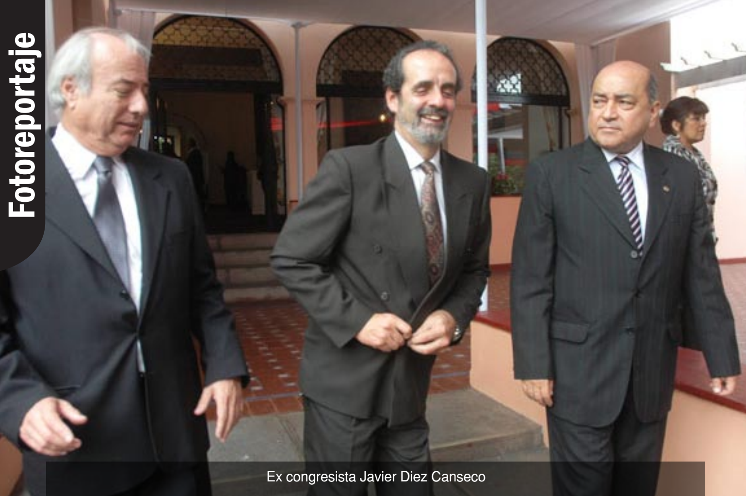
Ex congresista Javier Diez Canseco