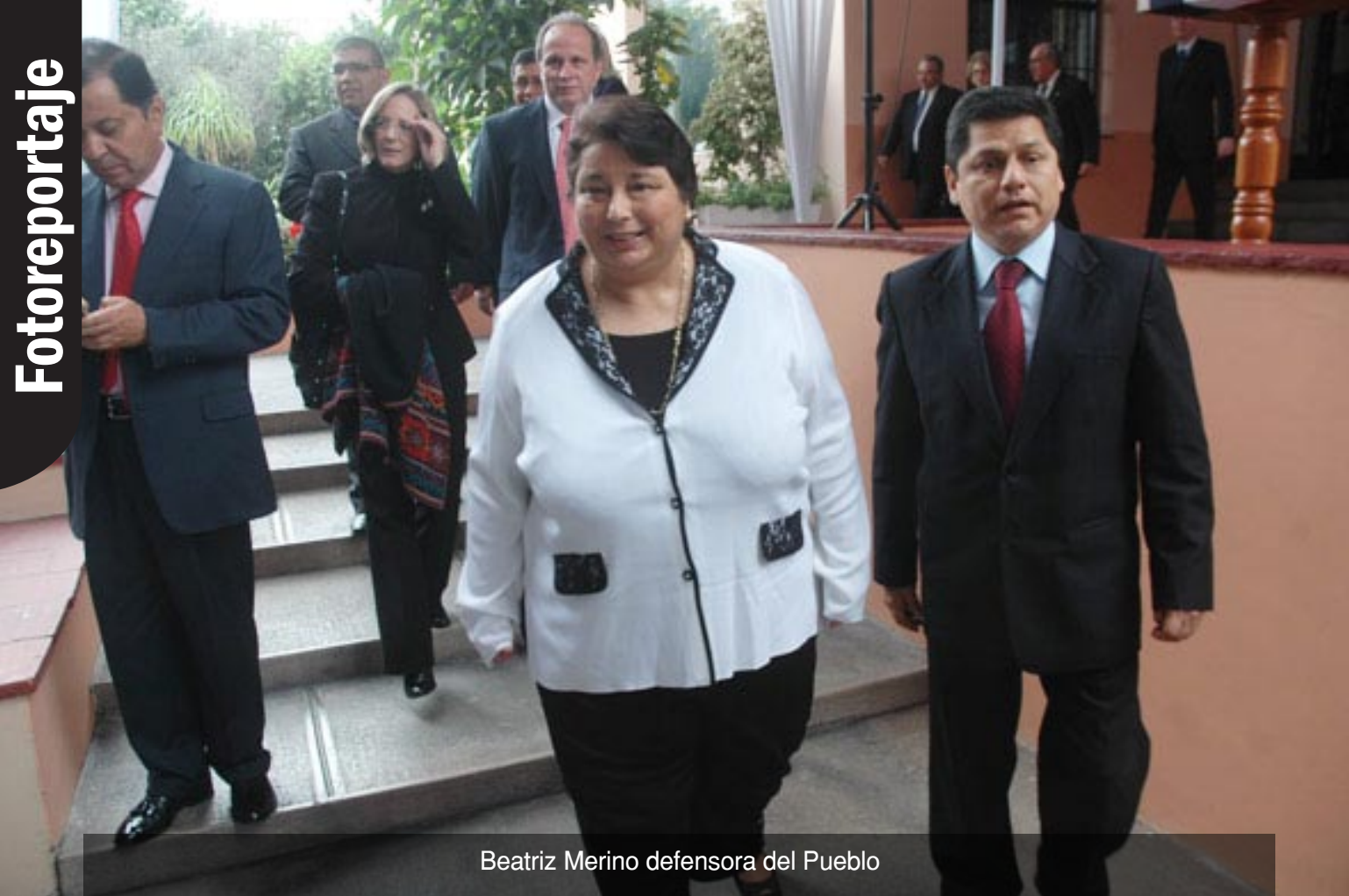
Beatriz Merino defensora del Pueblo