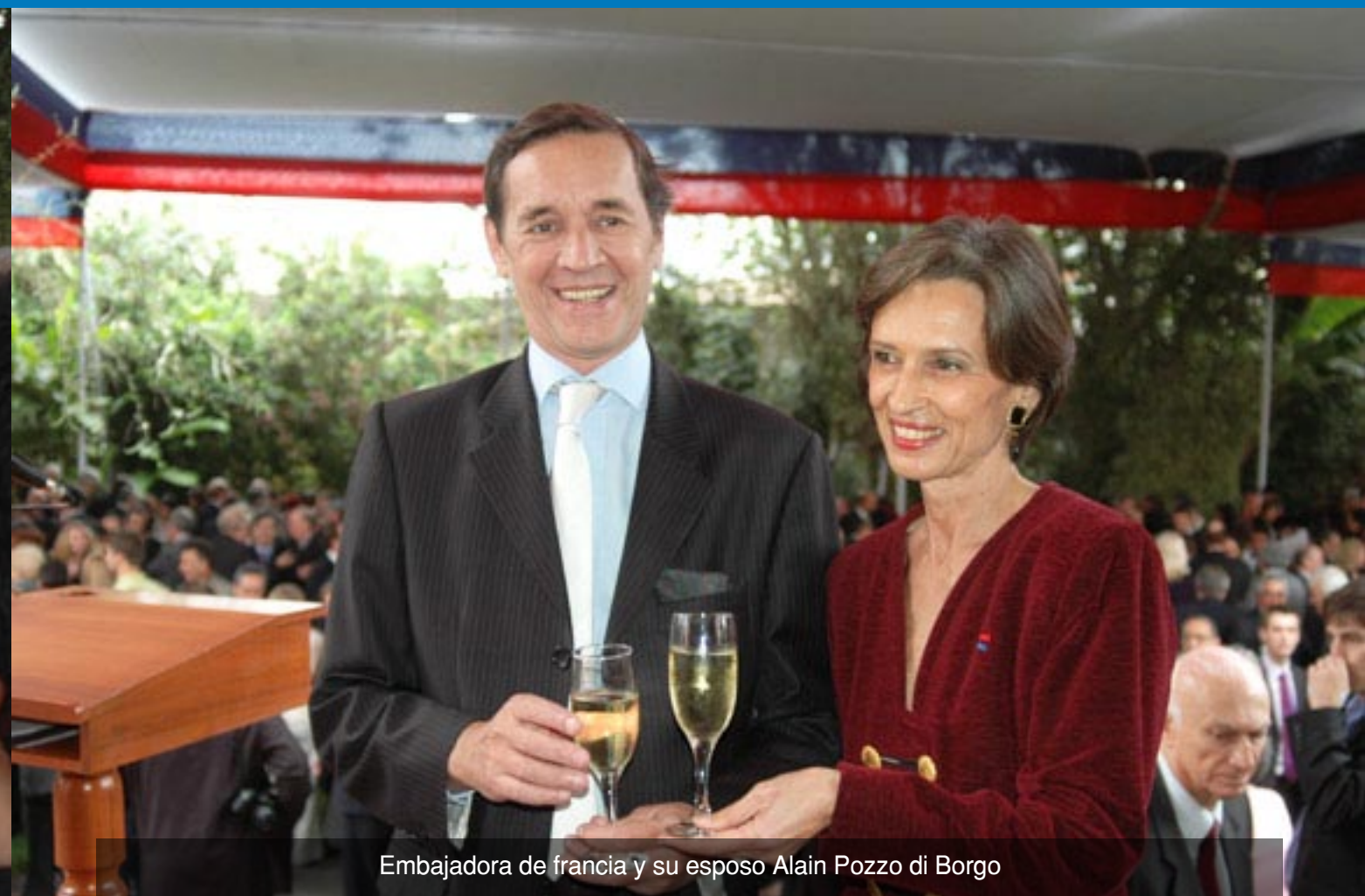
Embajadora de francia y su esposo Alain Pozzo di Borgo