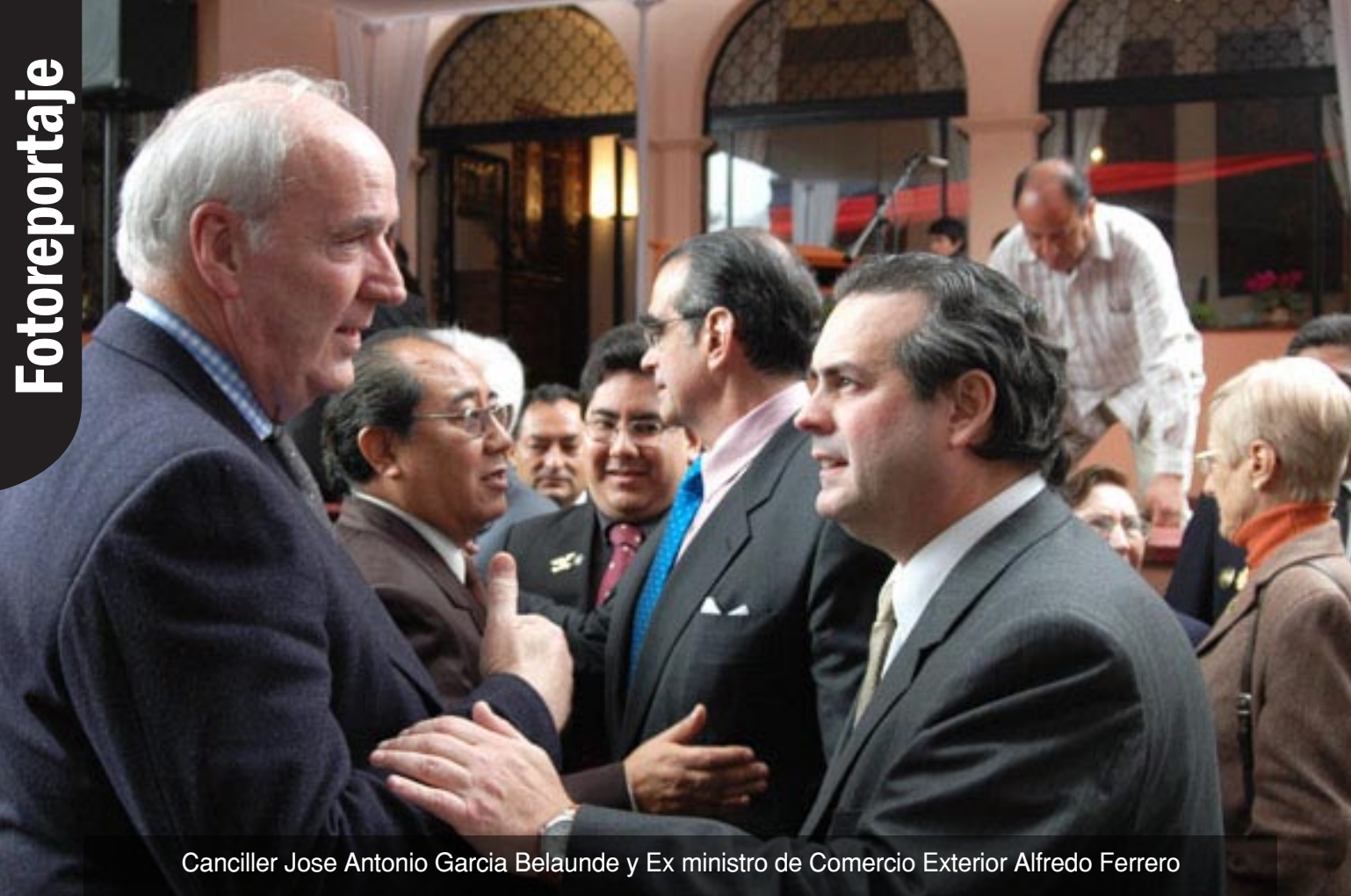
Canciller Jose Antonio Garcia Belaunde y Ex ministro de Comercio Exterior Alfredo Ferrero