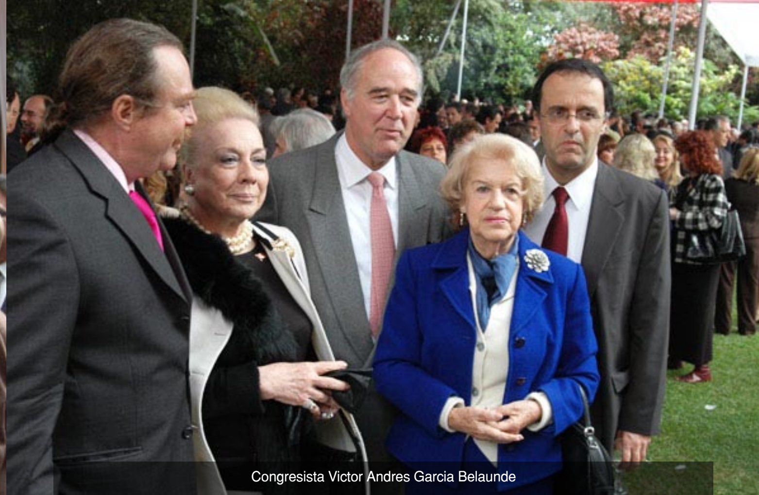
Congresista Victor Andres Garcia Belaunde