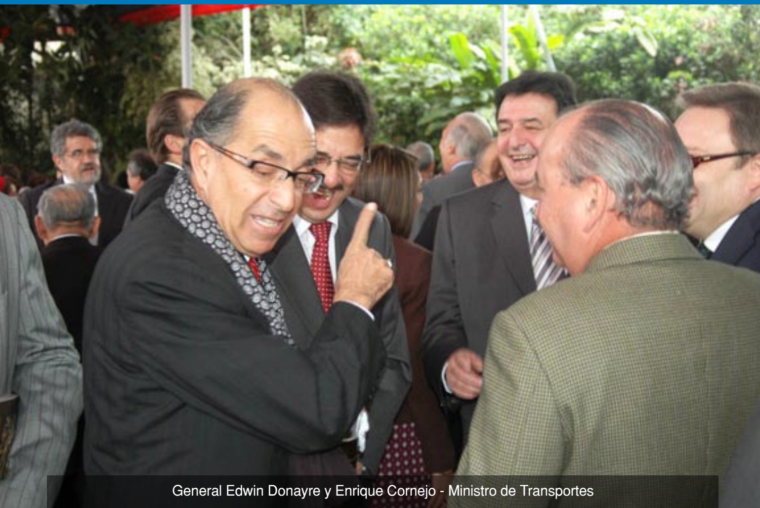
General Edwin Donayre y Enrique Cornejo - Ministro de Transportes