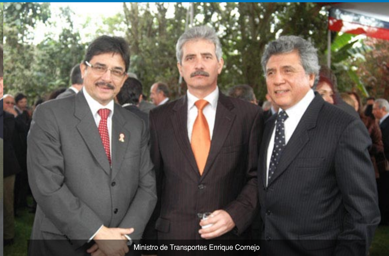
Ministro de Transportes Enrique Cornejo