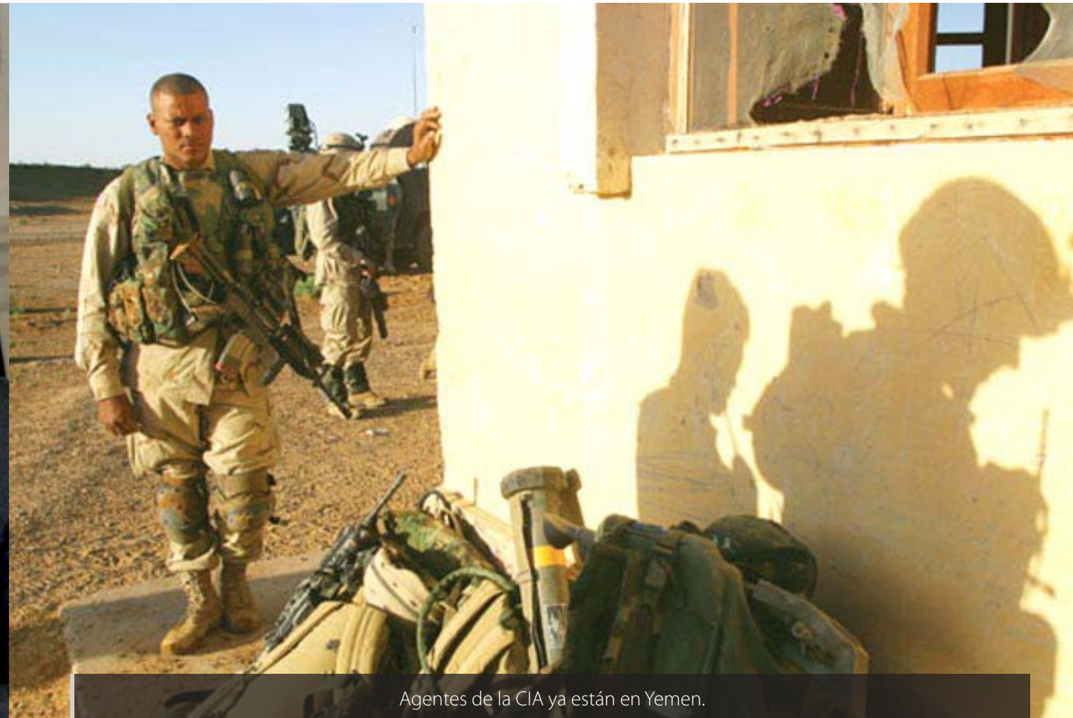
Agentes de la CIA ya están en Yemen.

mañana", declaró el legislador al canal de noticias FOX. "EE UU tiene una creciente presencia ahí, y la debemos mantener con operaciones especiales, boinas verdes y servicios secretos", agregó.