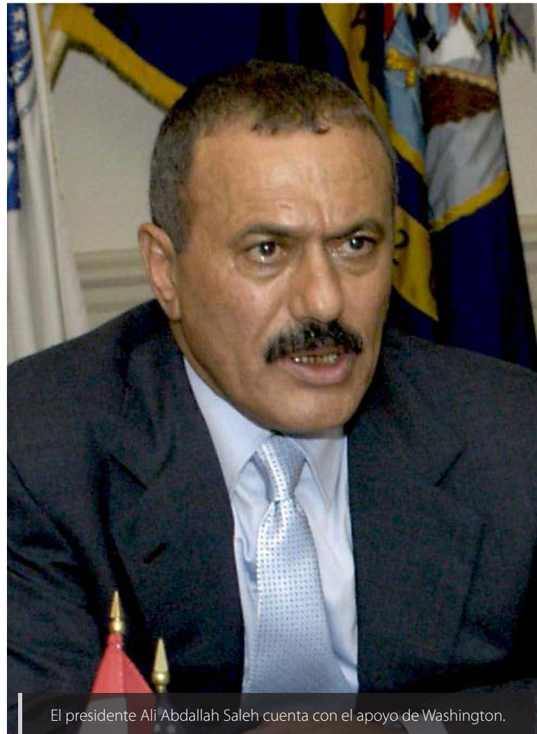
El presidente Ali Abdallah Saleh cuenta con el apoyo de Washington.

"Iraq, fue la guerra de ayer. Afganistán es la guerra de hoy. Si no actuamos preventivamente, Yemen será la guerra del