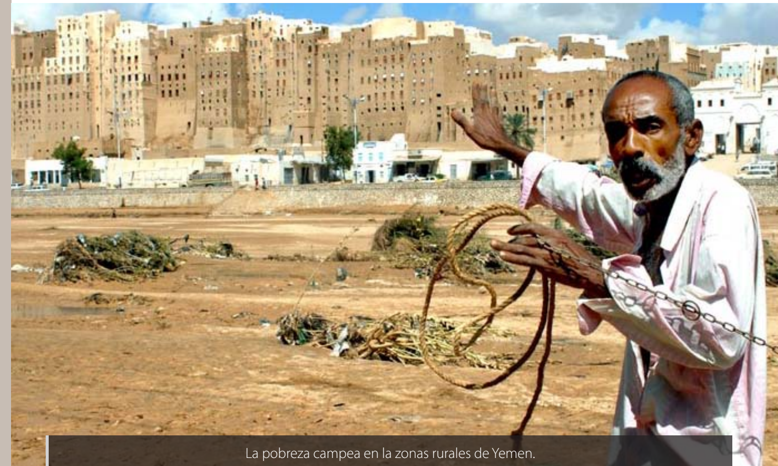
La pobreza campea en las zonas rurales de Yemen.

tosa crisis económica cuyas consecuencias se viven hoy.