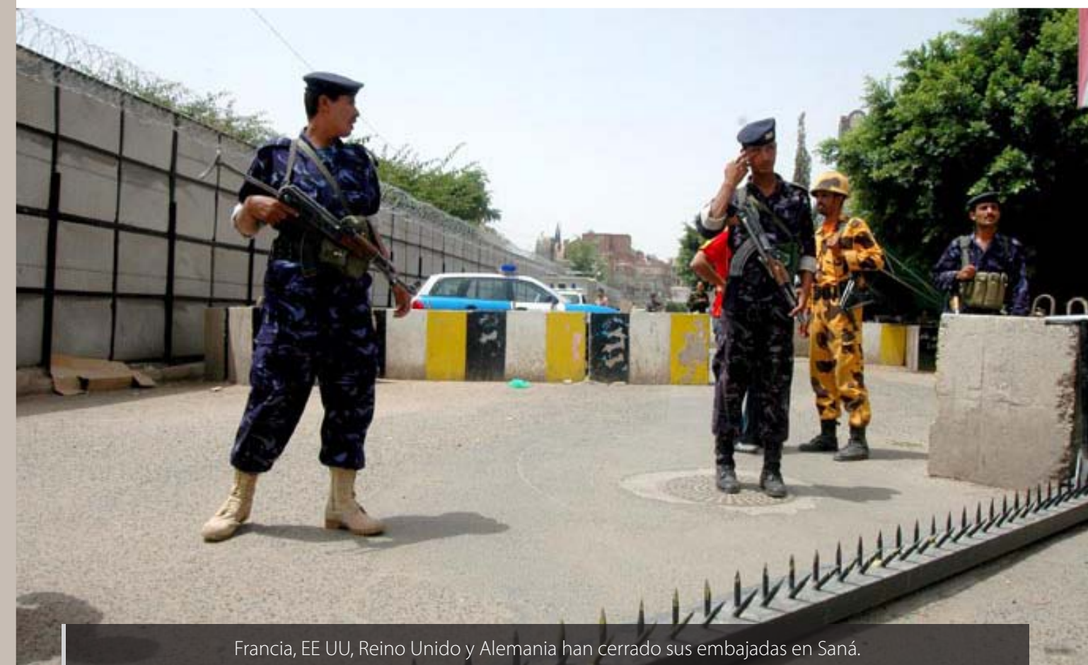
Francia, EE UU, Reino Unido y Alemania han cerrado sus embajadas en Saná.