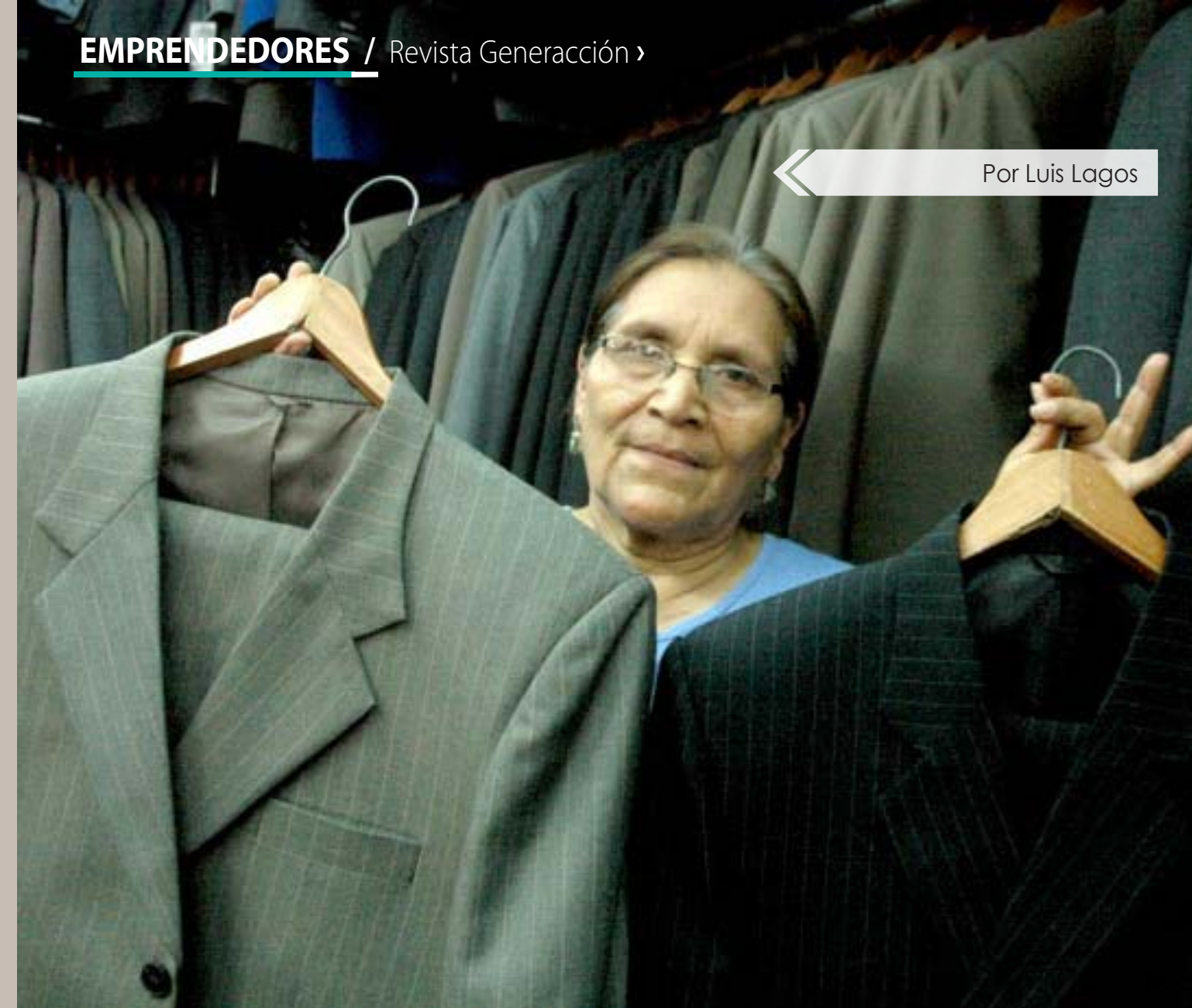
Por Luis Lagos