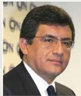
Por Juan Sheput