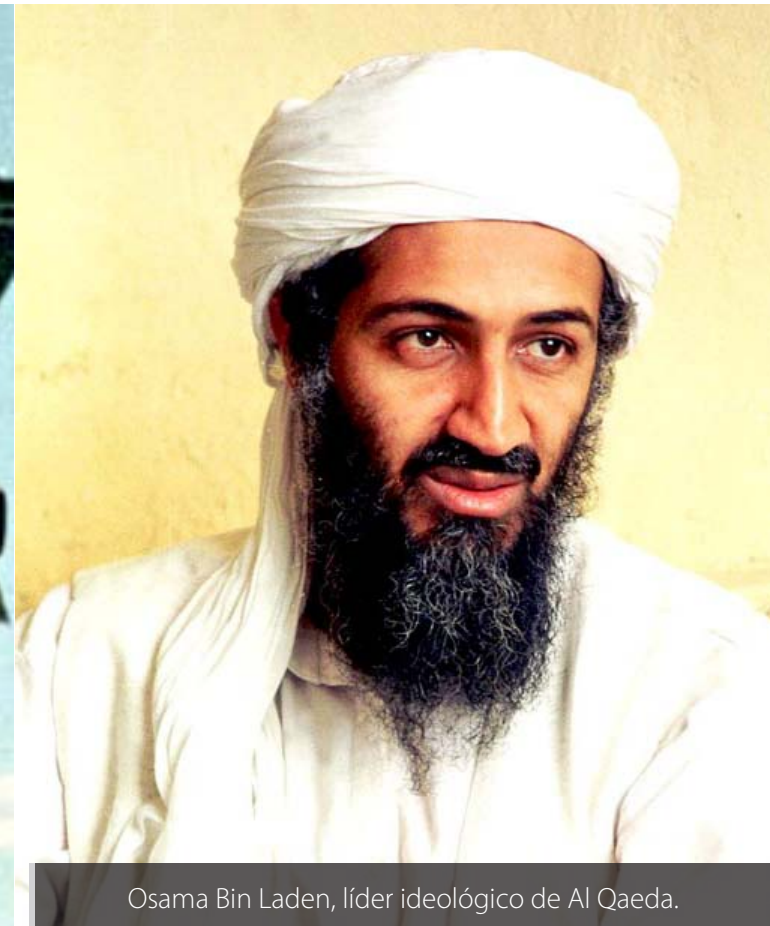
Osama Bin Laden, líder ideológico de Al Qaeda.

“Nuestro país no aceptará nunca la presencia de elementos terroristas extranjeros y estará en guardia contra cualquiera que trate de socavar la seguridad y la estabilidad”, señaló el canciller.