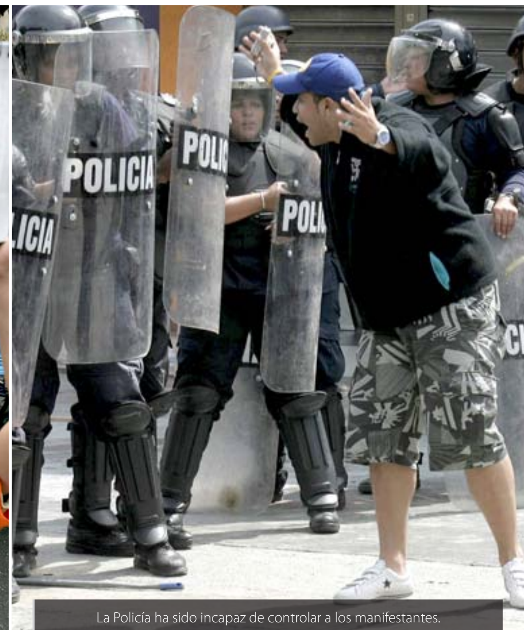
La Policía ha sido incapaz de controlar a los manifestantes.