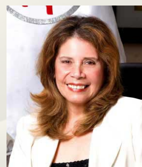
Por María del Pilar Tello

Bajo los principios de la ética y la responsabilidad social, comunicadores sociales de nuestro país animaron hace un tiempo un debate sobre su rol fundamental en la construcción del orden social y la gobernabilidad.