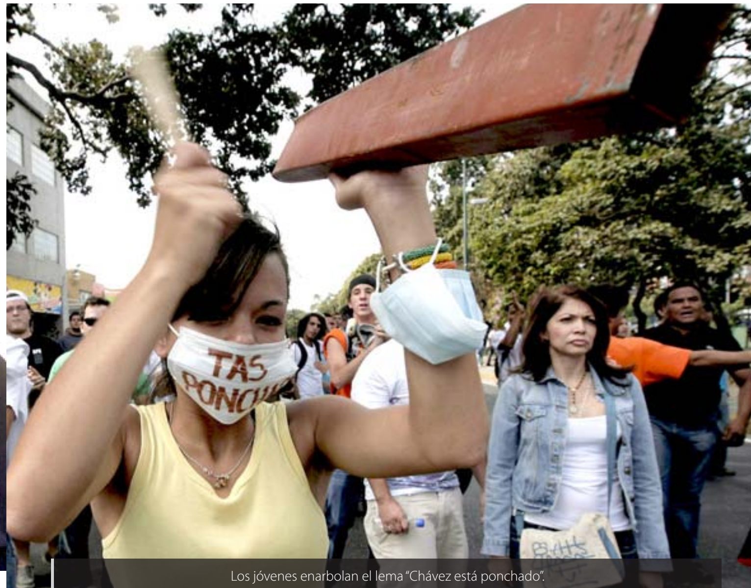
Los jóvenes enarbolan el lema "Chávez está ponchado".

En medio de un año clave para su gobierno