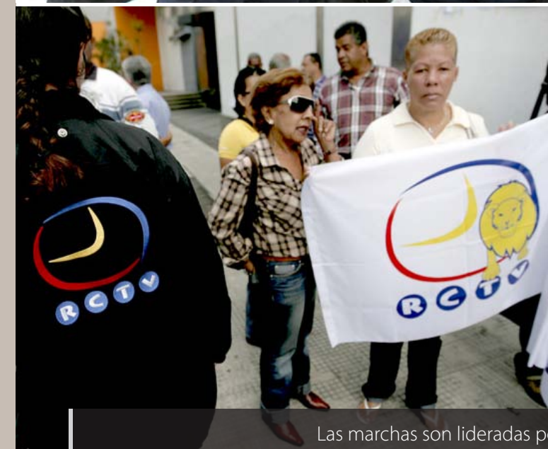
Las marchas son lideradas por un movimiento estudiantil.

Lo le queda es replegarse y concentrarse en casa, donde aún puede controlar la situación y no perder el Parlamento. A punta de balas y muerte, como es su costumbre. ■