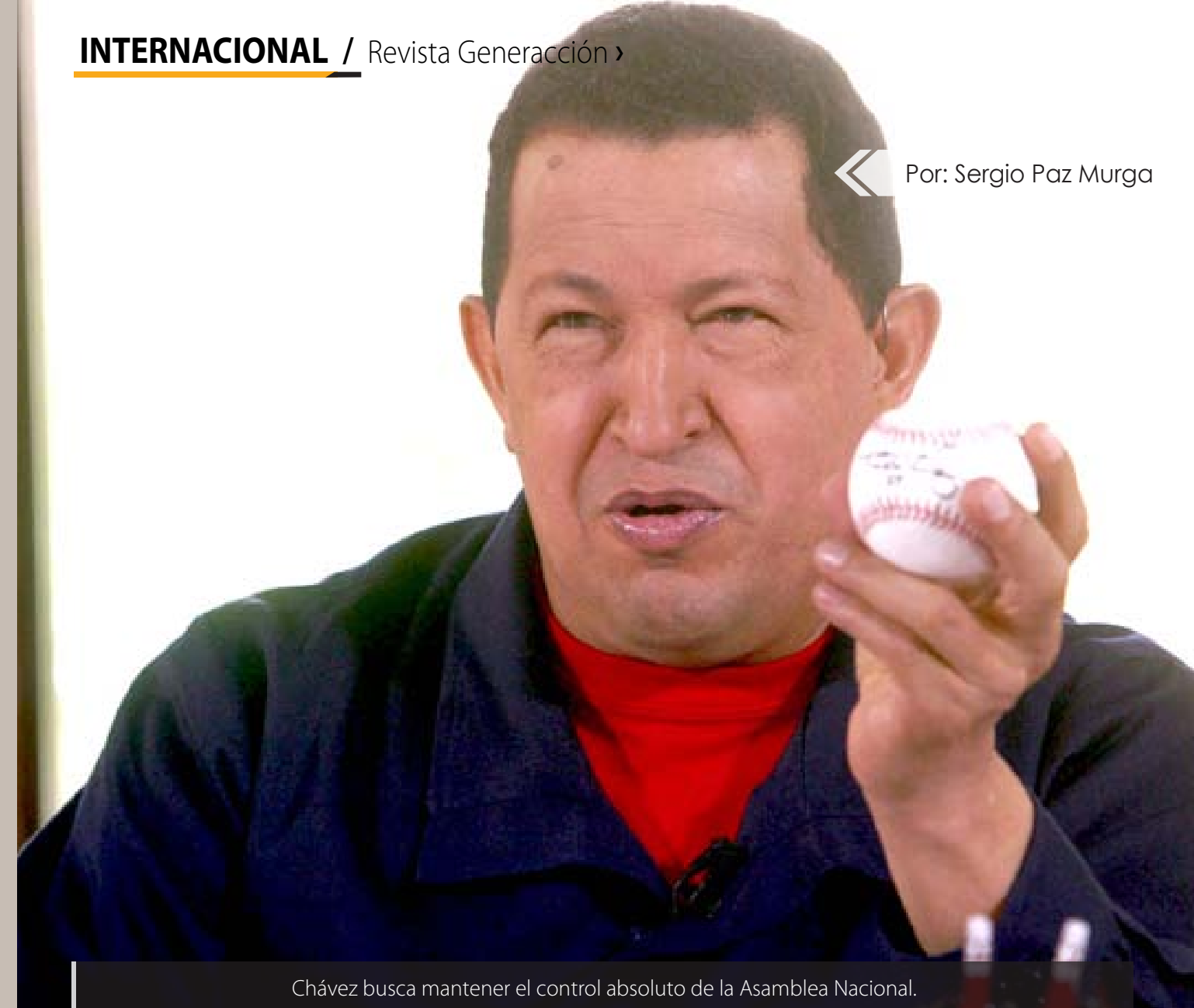
Chávez busca mantener el control absoluto de la Asamblea Nacional.