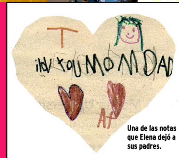
Una de las notas que Elena dejó a sus padres.