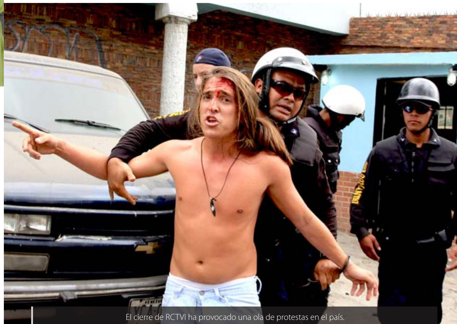
El cierre de RCTVI ha provocado una ola de protestas en el país.

El temor del mandatario es que el movimiento estudiantil resurja y tome fuerza como la que alcanzó en el 2007 cuando provocó la derrota de Chávez en un referéndum constitucional y la victoria de varios candidatos opositores en las elecciones municipales del 2009.