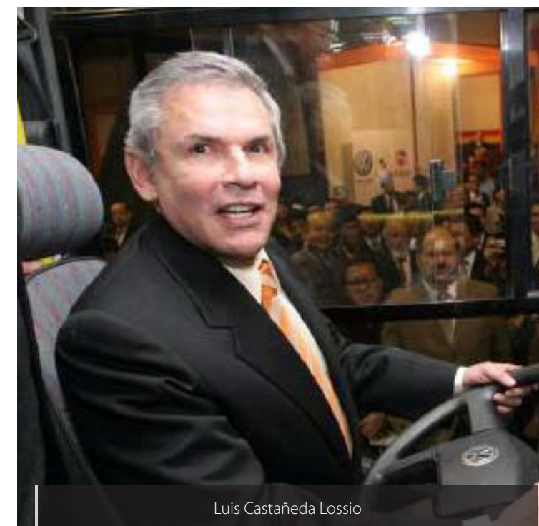
Luis Castañeda Lossio

“ Luis Castañeda Lossio ha demostrado gran incapacidad para el cargo. Se sostiene gracias al conjunto de abogados sin ética que apelan a leguleyadas ”