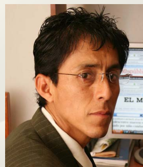
Por Luis Lagos

La informalidad y la ansiedad de vivir al margen del Estado se han insertado inmensamente en las necesidades de diversos sectores de la población.