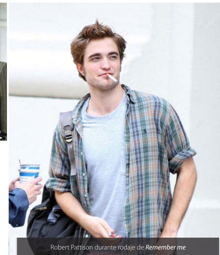
Robert Pattinson durante rodaje de Remember me

Robert Pattinson lo describió así: "Sus padres son muy ricos, pero él se cree moralmente superior y es un tanto vago.