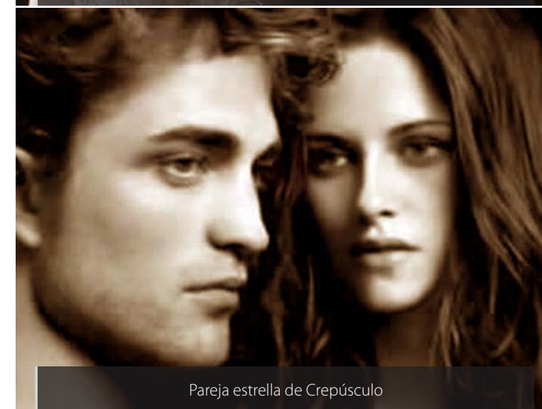
Pareja estrella de Crepúsculo