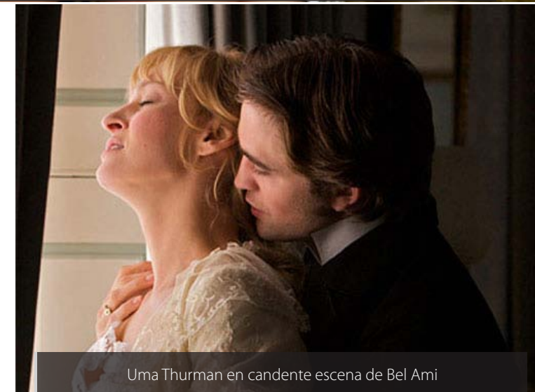
Uma Thurman en candente escena de Bel Ami

El reto está planteado, deberá Robert Pattinson demostrar que él puede estar a la altura de cualquier proyecto, sin que Kristen Stewart o Taylor Lautner lo secunden en la comparsa del éxito garantizado que les da interpretar una historia escrita por Stephenie Meyer. ■