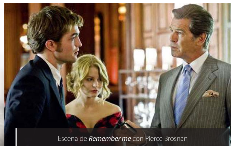
Escena de Remember me con Pierce Brosnan

Robert Pattinson no deja de ser algo enigmático y misterioso como personaje mediático. Este actor británico de 23 años tiene al mundo expectante de cada paso que da o decide no dar; una atención que seguramente lo había convirtiéndolo en un "bicho raro" como dijera Chris Weitz, el director de Luna Nueva , quien lo describió así.