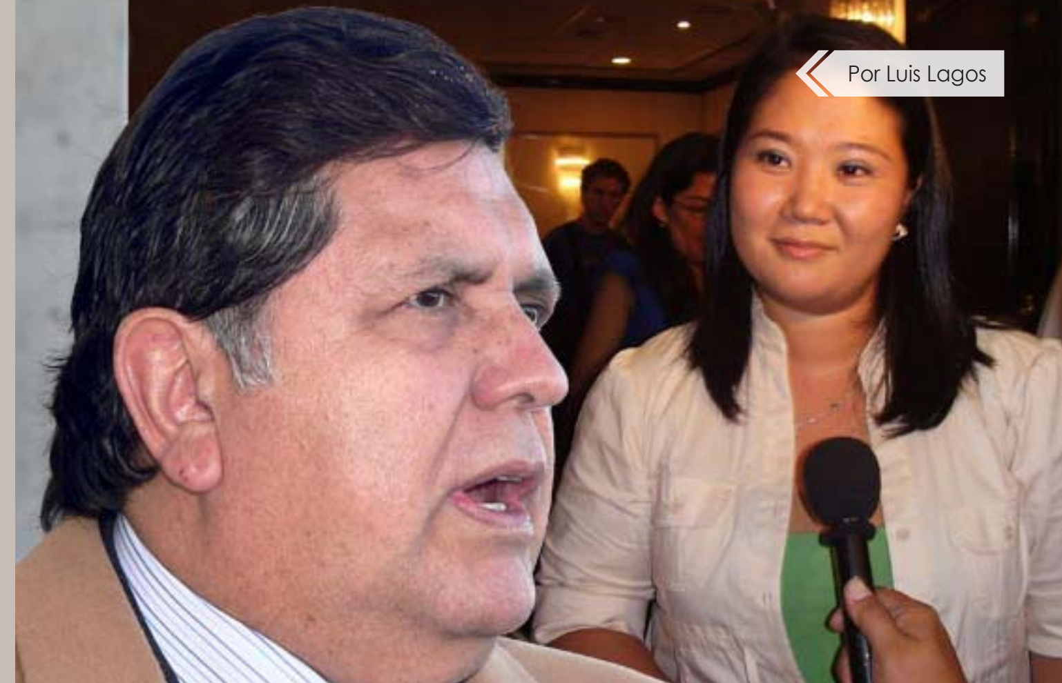
Por Luis Lagos