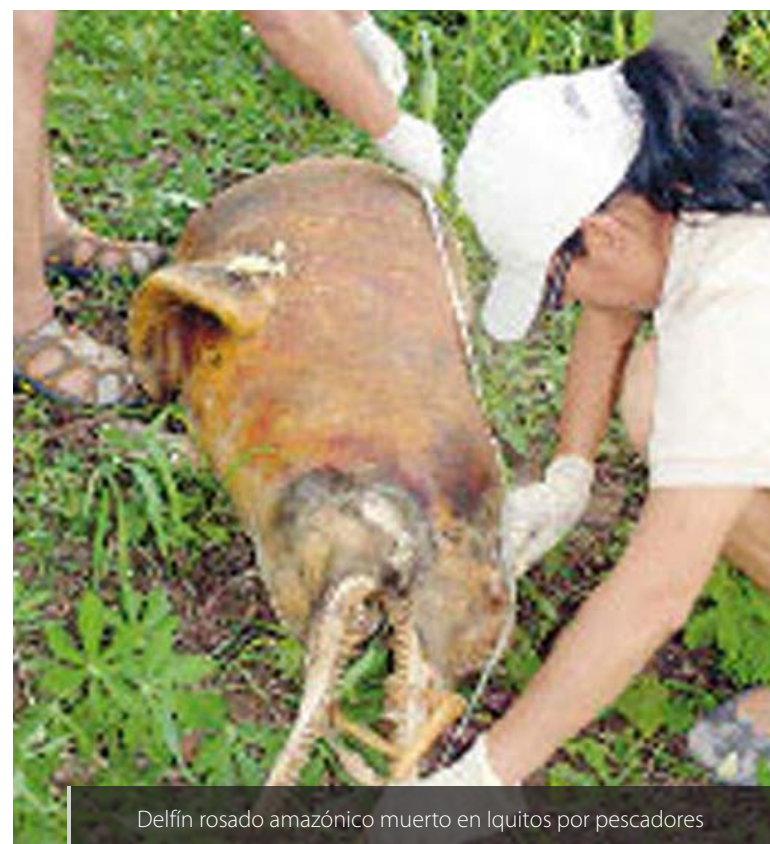
Delfín rosado amazónico muerto en Iquitos por pescadores

Pero eso no ocurrirá hasta tomar el tema de la biodiversidad como una bandera. Un día como el Día Internacional de la Biodiversidad debe repetirse hasta que el mensaje haya traspasado nuestra indiferencia. Hasta que nos hayamos dado cuenta que al proteger a un caimán negro nos protegemos. Hasta que reconozcamos que al evitar que una tortuga verde desaparezca estaremos más tiempo en la tierra, completos y siendo únicamente diversos.