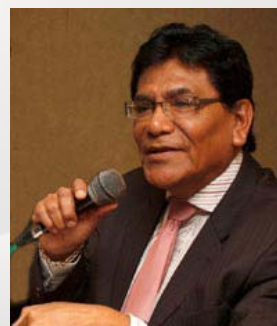
Por César Huamanchumo

Generación presenta una irónica columna de opinión al estilo de César Huamanchumo.