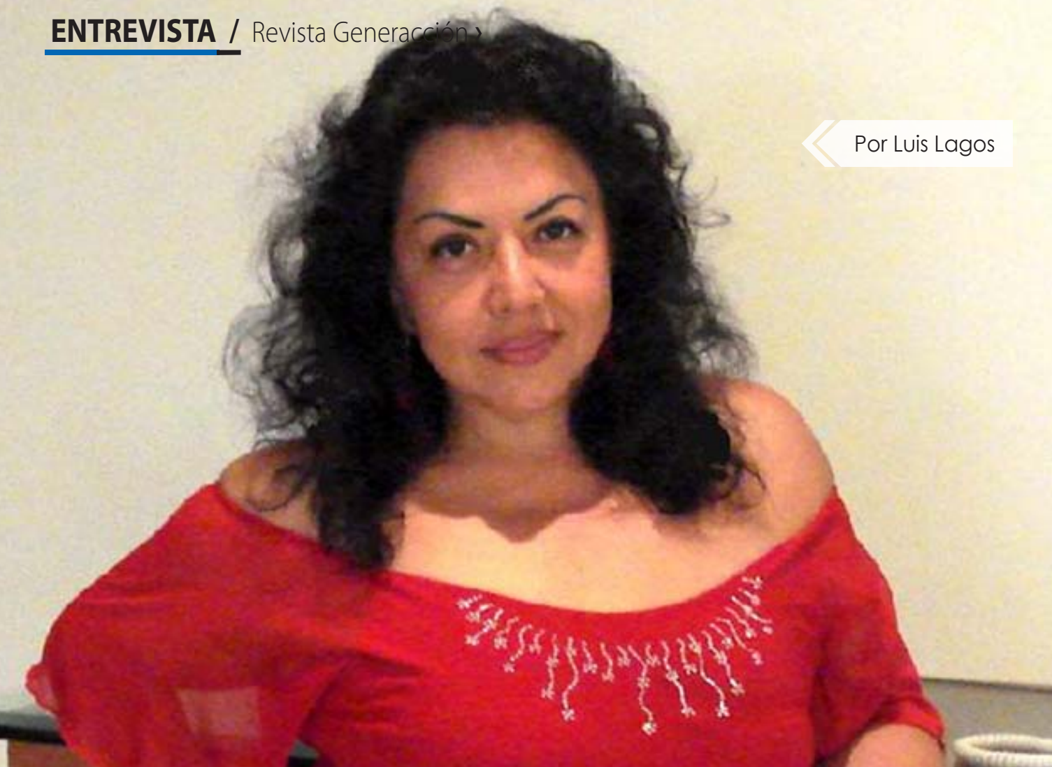
« Por Luis Lagos