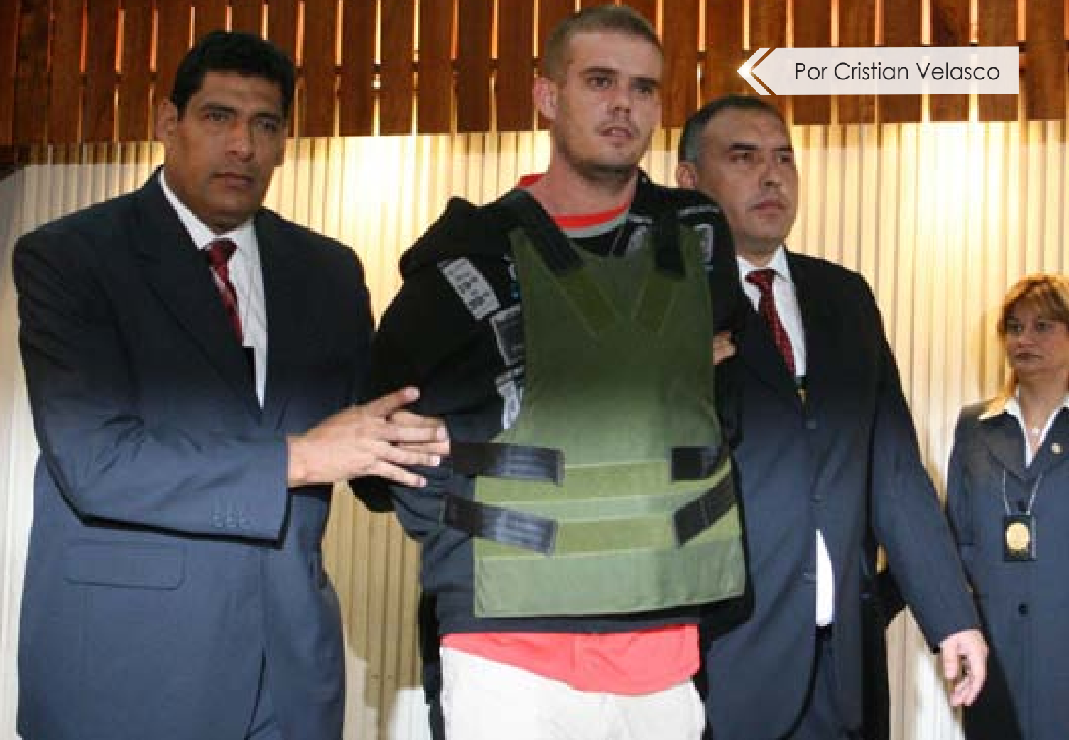
Por Cristian Velasco