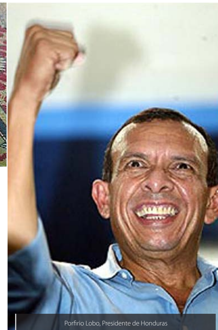
Porfirio Lobo, Presidente de Honduras

Así hayan sido grupos organizados los que perpetraron estos actos, tal vez pagados por el gobierno como ha ocurrido en otros países, ¿no es obvio el por qué? ¿No está claro que se quiere censurar a la prensa que incomoda?