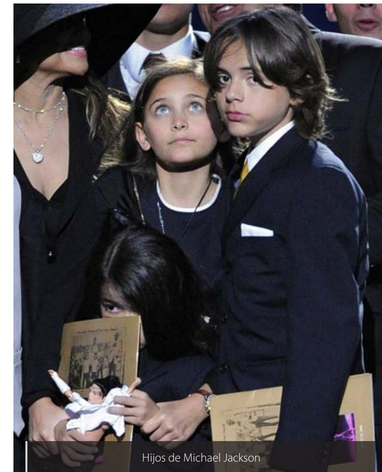
Hijos de Michael Jackson

Por ello conocer las millonarias cifras de los ingresos financieros que la familia ha percibido en este primer año de fallecido resultan favorables para sus herederos, que nada tenían que ver con la locura y desequilibrio emocional