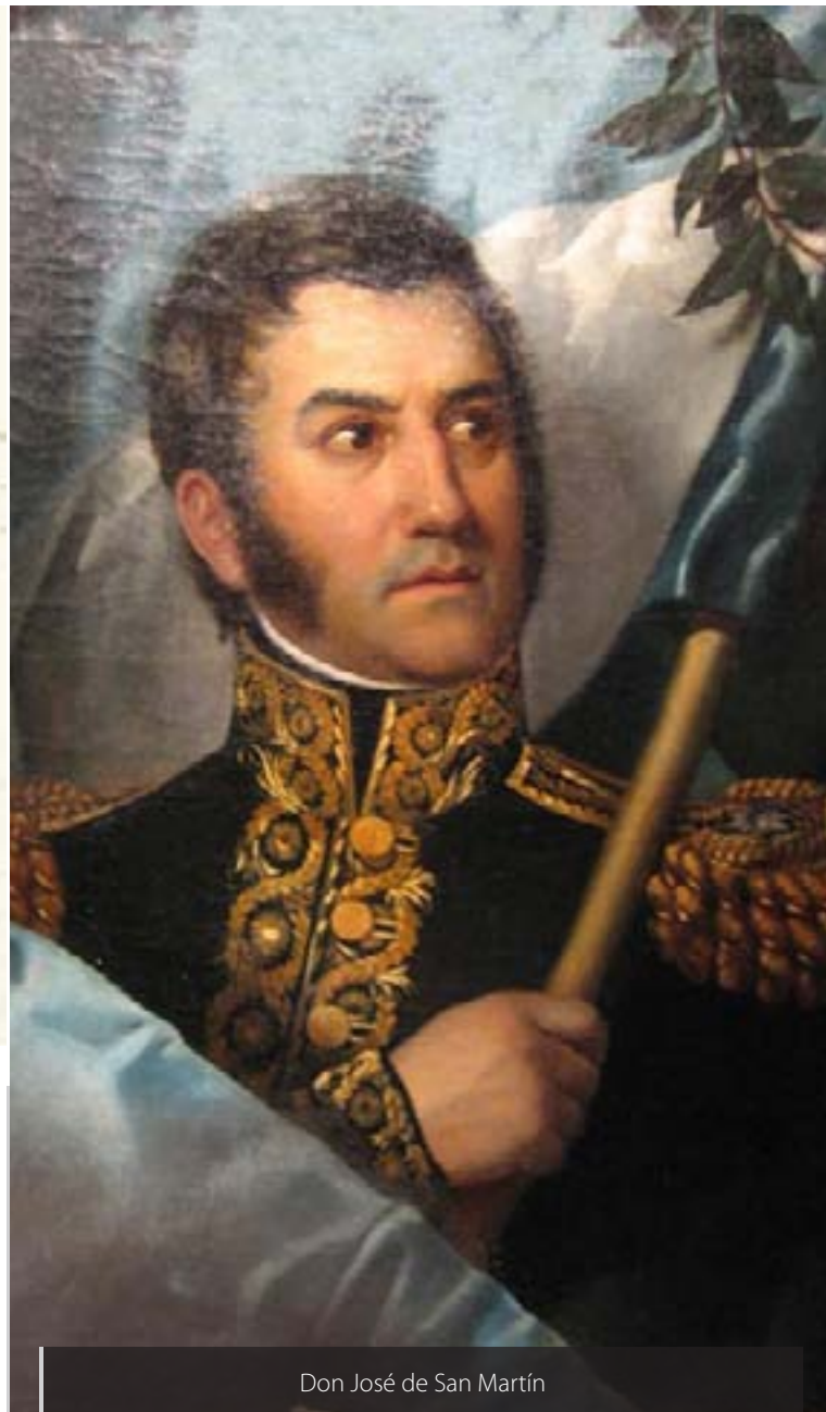
Don José de San Martín