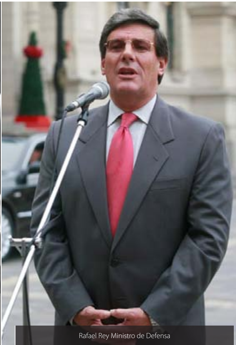
Rafael Rey Ministro de Defensa

“ Algún desconocido introdujo la estrofa apócrifa del Himno Nacional y nos mantuvo engañados por más de 100 años ”