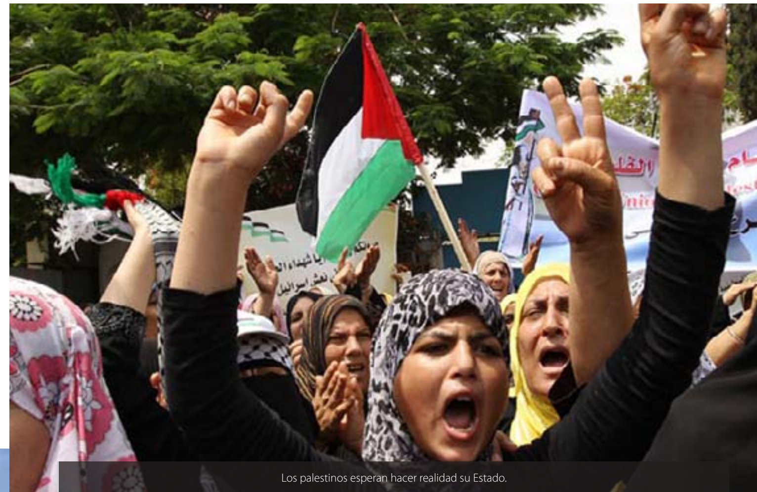
Los palestinos esperan hacer realidad su Estado.

Como aseguran algunos expertos, la frustración en el resarcimiento a las demandas históricas de los palestinos