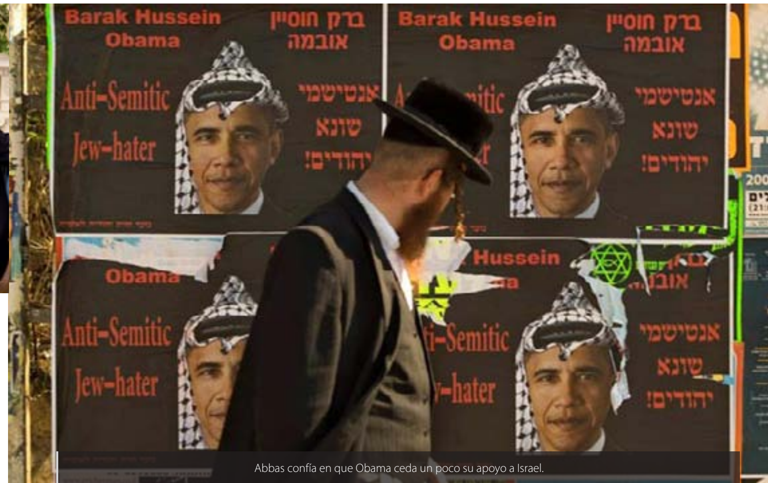
Abbas confía en que Obama ceda un poco su apoyo a Israel.

Pero Netanyahu no está solo. Su gobierno está sostenido por partidos de la ultraderecha israelí que pueden dar más de un problema a la hora de las negociaciones. Basta nombrar a Israel Beitenu, del actual canciller Avigdor