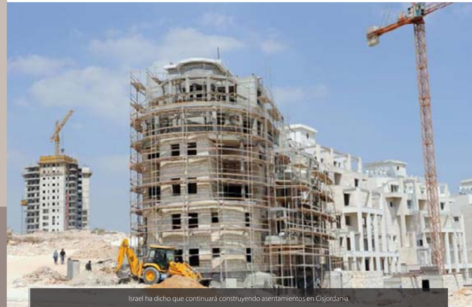
Israel ha dicho que continuará construyendo asentamientos en Cisjordania.

A la luz de estos acontecimientos, solo quedaría esperar a que ambas partes se sienten y tengan presente que de lo que se trata acá es de hacer sacrificios máximos y dolorosos. Y, como diría George Mitchell, el mediador estadounidense en la región, “la solución menos imperfecta de hoy puede llegar a ser la paz más perfecta del mañana”. ■