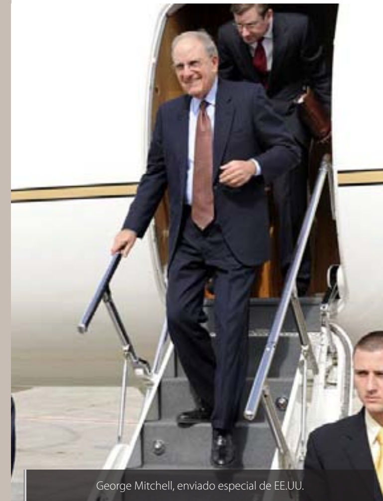
George Mitchell, enviado especial de EE.UU.

“ Netanyahu está atado de manos en su gobierno a unos socios que no cederán ni un ápice en temas tan delicados como la evacuación de colonias en los territorios palestinos ocupados ”