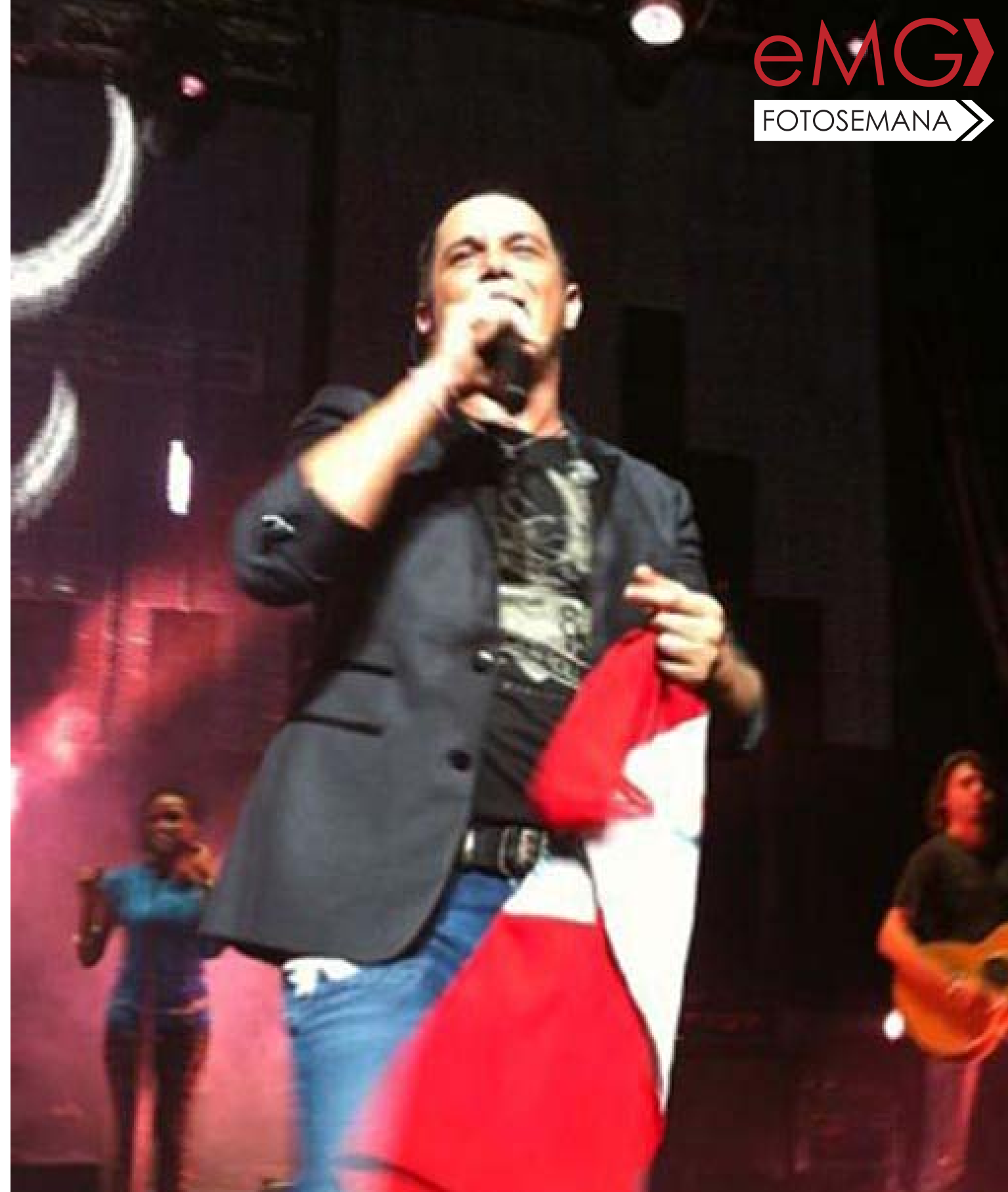
Alejandro Sanz luce Bandera peruana en Estados Unidos

El cantante español Alejandro Sanz lució una Bandera peruana durante el concierto que ofreció en el estado de Virginia, en Estados Unidos. Un anticipo de lo que será su concierto en Lima, en octubre. Fue una admiradora peruana la que logró abrirse paso entre la multitud que asistía al concierto y alcanzó a su ídolo la Bandera que el intérprete sostuvo con mucho cariño.