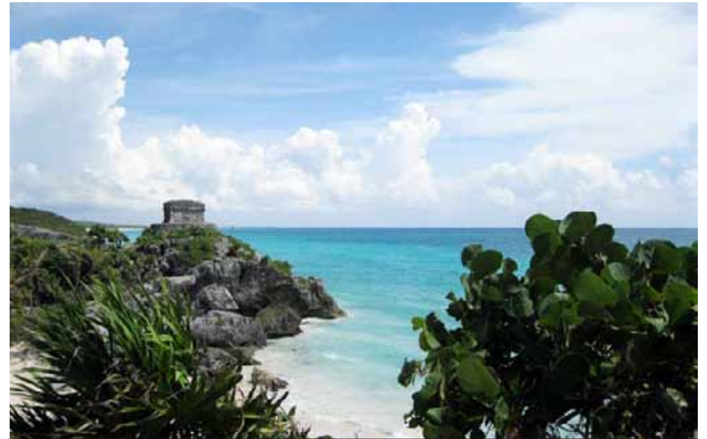
Otra de las famosas vistas de Tulum