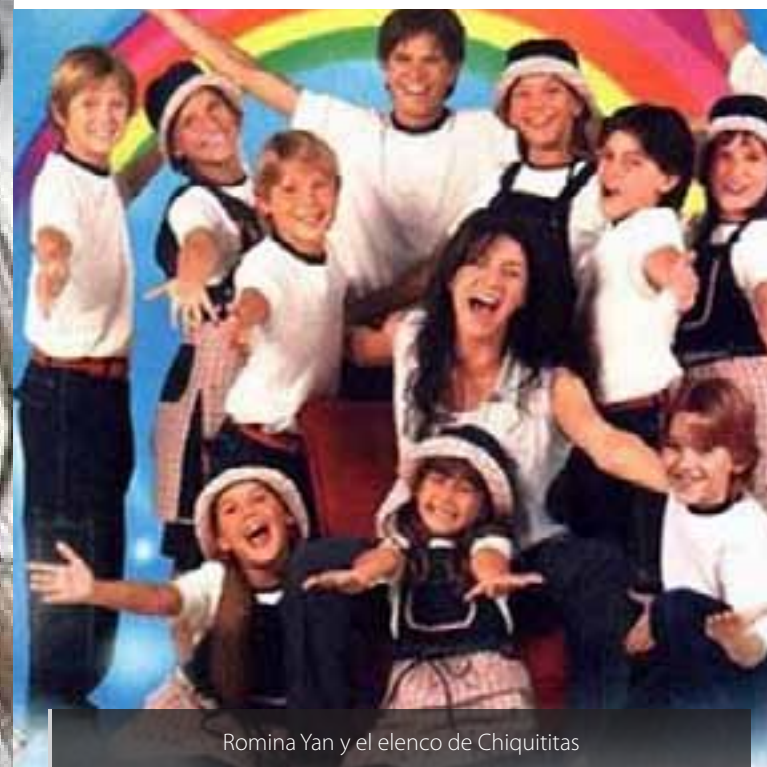
Romina Yan y el elenco de Chiquititas

Romina Yankelevich era dueña de una sonrisa contagiante y sincera, conquistó a los niños y adolescentes de muchos países con el personaje de Belén Fraga , la directora de un hogar de huérfanos que trataba de hacerles la vida más ligera y menos dolorosa en Chiquititas . Poseía un carisma especial que trascendía las pantallas de televisión, se conectaba con la simplicidad que la caracterizaba. La telenovela duró ocho temporadas,