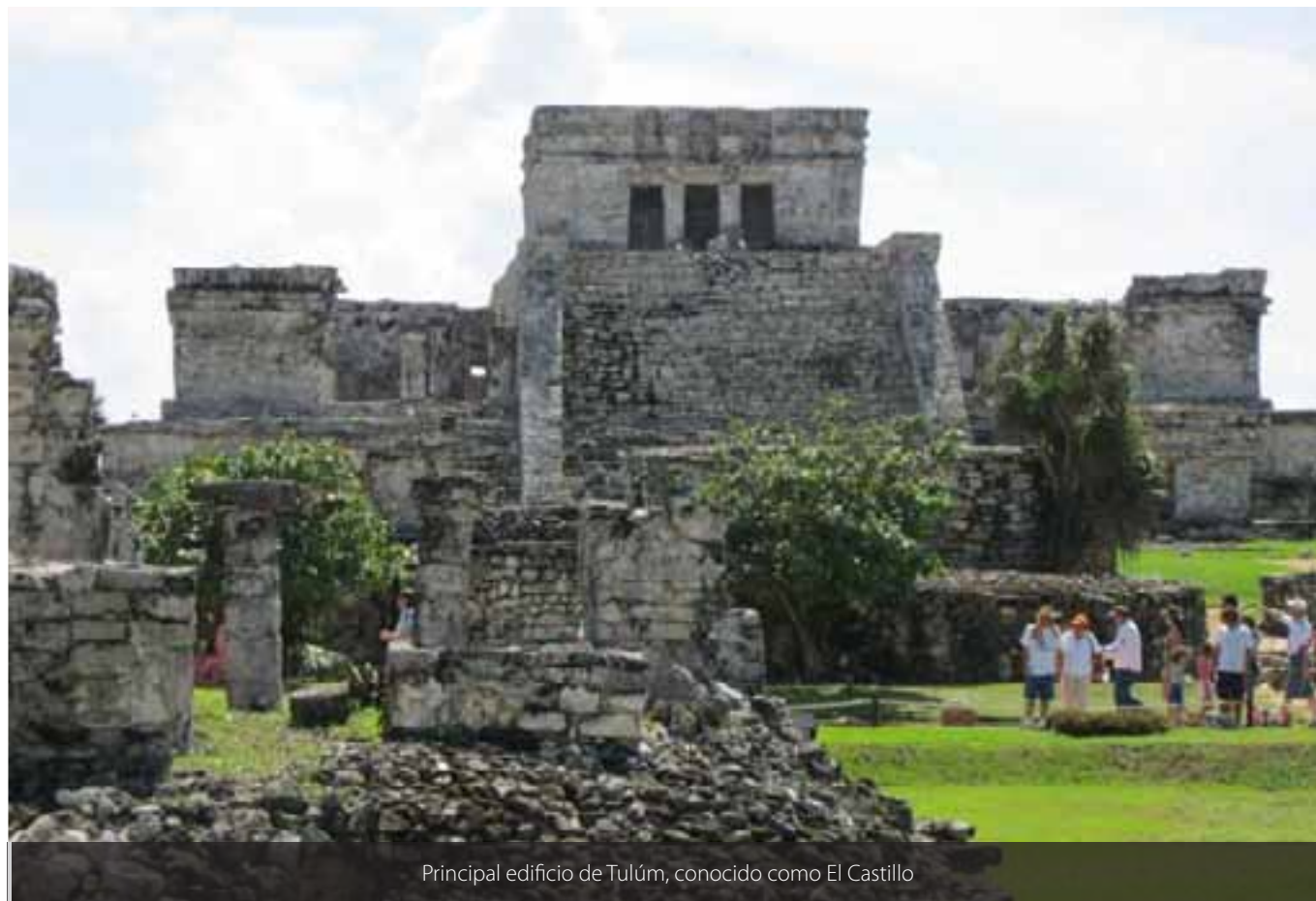
Principal edificio de Tulum, conocido como El Castillo