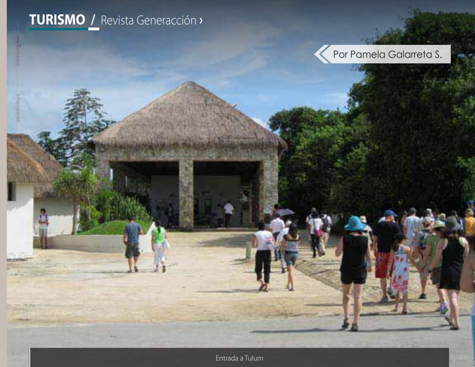
Entrada a Tulum