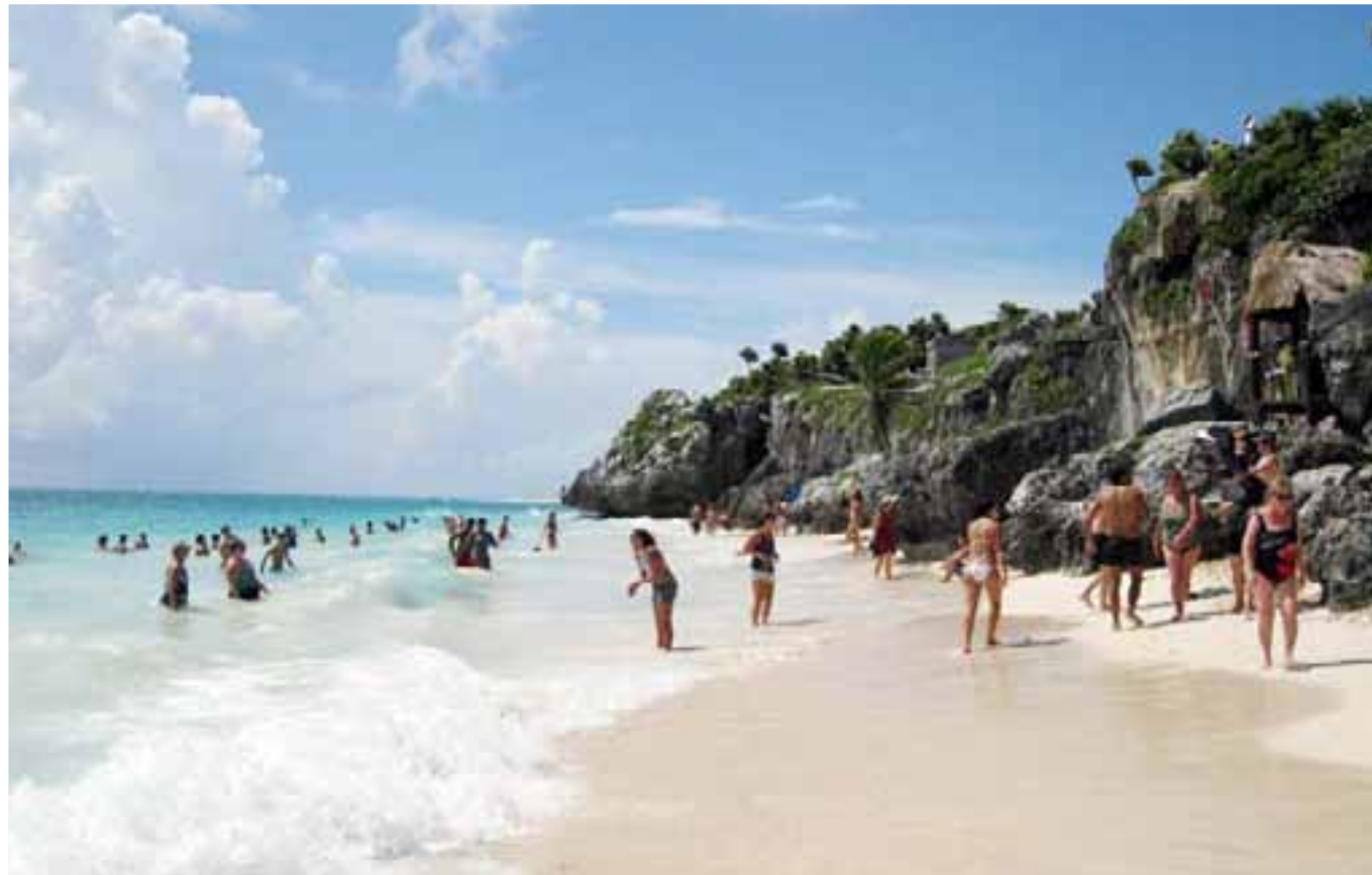
Turistas y locales disfrutando de las aguas del mar de Tulum