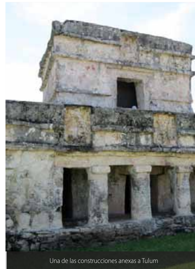
Una de las construcciones anexas a Tulum