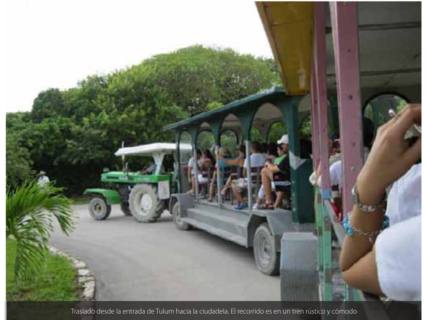
Traslado desde la entrada de Tulum hacia la ciudadela. El recorrido es en un tren rústico y cómodo