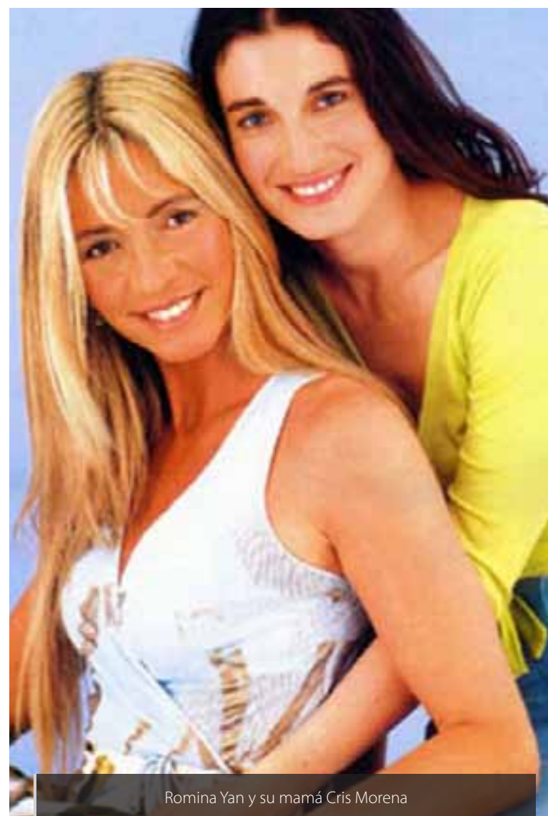
Romina Yan y su mamá Cris Morena

una mujer que entregó su espíritu a los niños, no solo actuando, sino también con el canto y la conducción de espacios infantiles en la televisión no solo argentina.