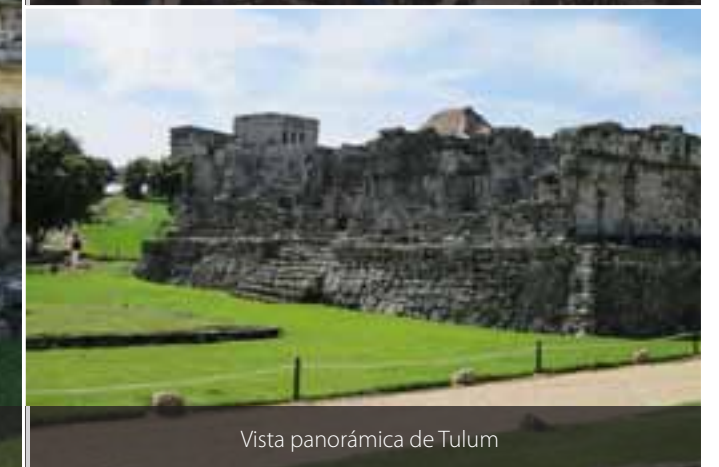
Vista panorámica de Tulum