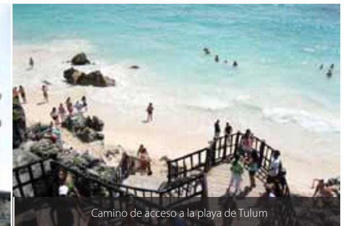
Camino de acceso a la playa de Tulum