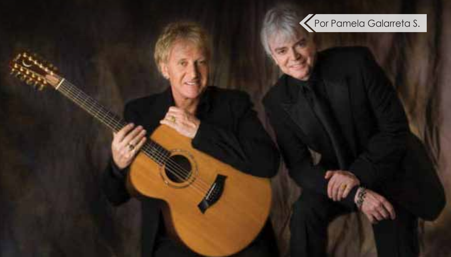
◀ Por Pamela Galarreta S.