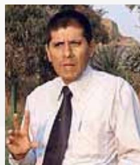
Por Wilfredo Pérez Ruiz (*)

(*) Expositor de etiqueta social en el Instituto de Secretariado ELA y la Corporación Educativa Columbia. Docente y consultor en protocolo, imagen personal e institucional y etiqueta.