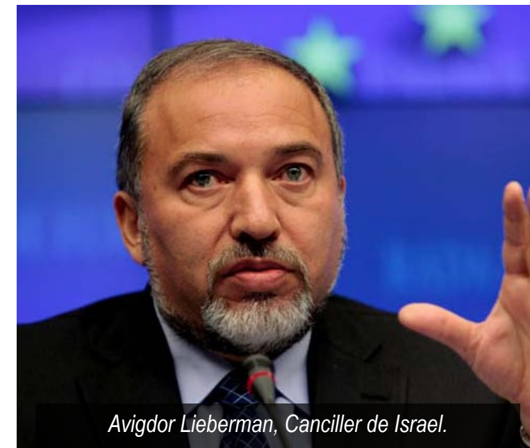
Avigdor Lieberman, Canciller de Israel.

Rodkin señaló que una muestra de la excelente relación de Israel con Perú se evidencia en que el año pasado inversionistas israelíes invirtieron en nuestro país al menos US$ 1,200 millones. La perspectiva es que esta cifra se duplique en los próximos años.