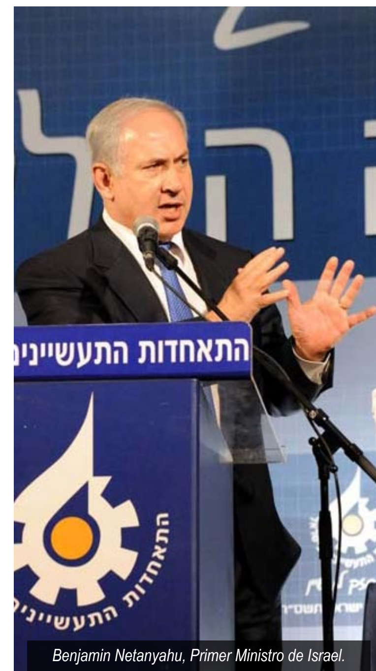
Benjamin Netanyahu, Primer Ministro de Israel.

Sí, en 1988 en Argelia, pero era una época diferente. No fue bajo la Autoridad Nacional