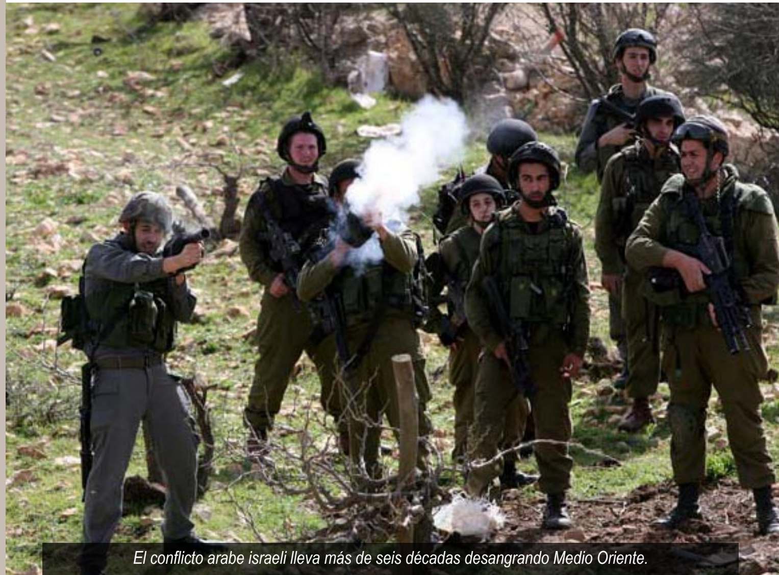
El conflicto arabe israeli lleva más de seis décadas desangrando Medio Oriente.

“ Reconocer un Estado con unas fronteras de hace cuatro décadas –de antes de la Guerra de los Seis Días– es muy “raro”, por no utilizar otra palabra ”