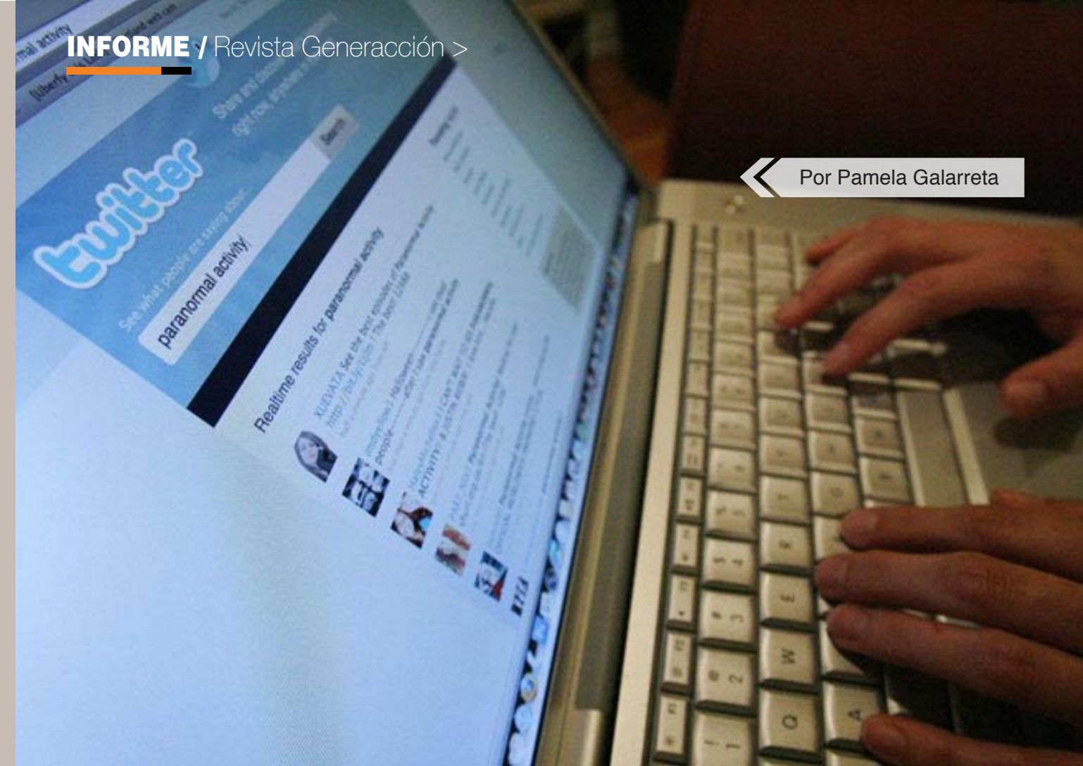
◀ Por Pamela Galarreta

Popularidad de página ha descendido en los últimos meses