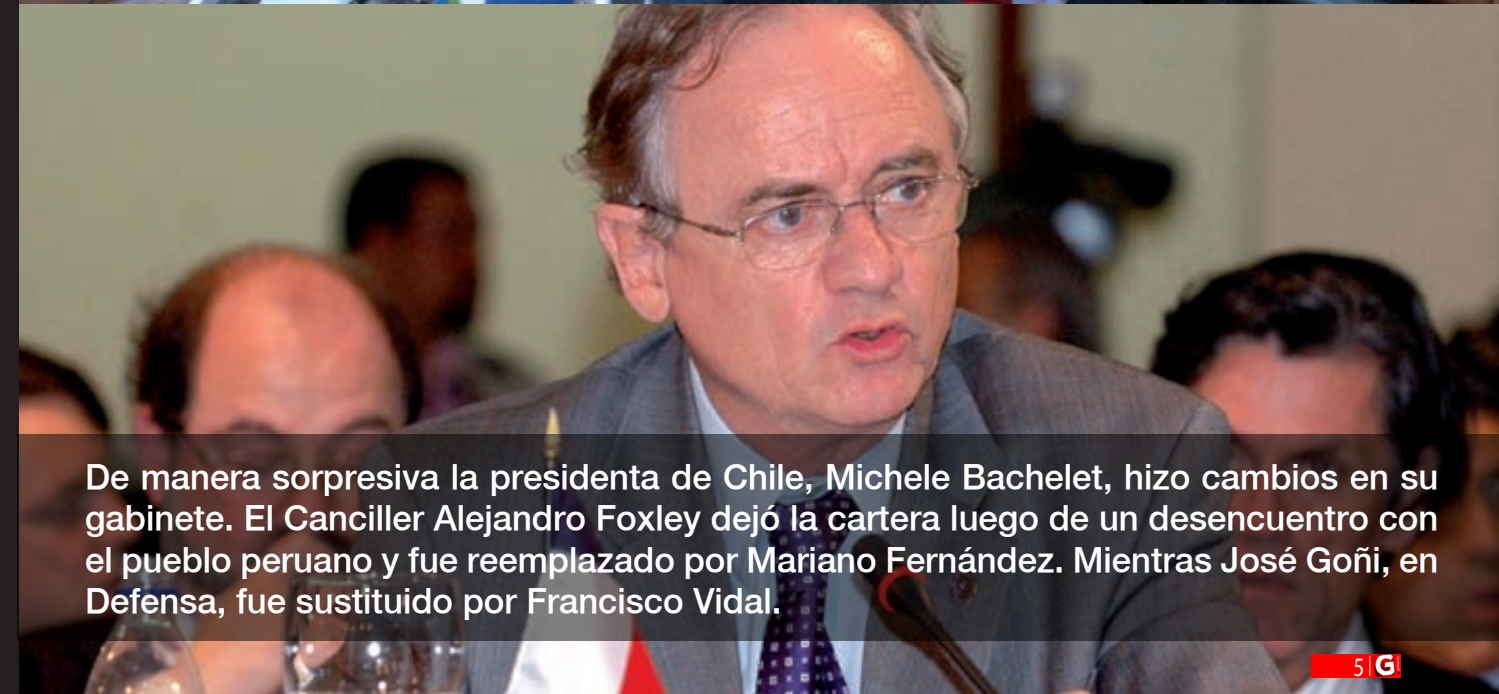
De manera sorpresiva la presidenta de Chile, Michele Bachelet, hizo cambios en su gabinete. El Canciller Alejandro Foxley dejó la cartera luego de un desencuentro con el pueblo peruano y fue reemplazado por Mariano Fernández. Mientras José Goñi, en Defensa, fue sustituido por Francisco Vidal.