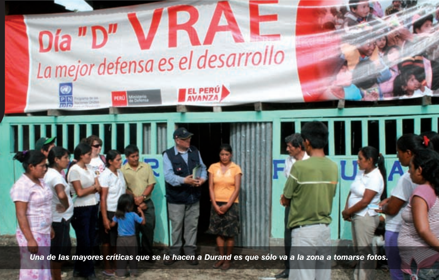
Una de las mayores críticas que se le hacen a Durand es que sólo va a la zona a tomarse fotos.

Según el punto de vista de los principales analistas y de los propios gestores del plan VRAE, el aspecto de desarrollo socio económico es el más importante; incluso más que el plano militar de lucha contra los remanentes subversivos y que el plano policial de lucha contra los narcotraficantes de la zona. Esto quizás sea debido a que, mientras haya pobreza y falta de oportunidades de progreso en el valle, va a ser muy difícil terminar con la subversión y el tráfico de drogas.