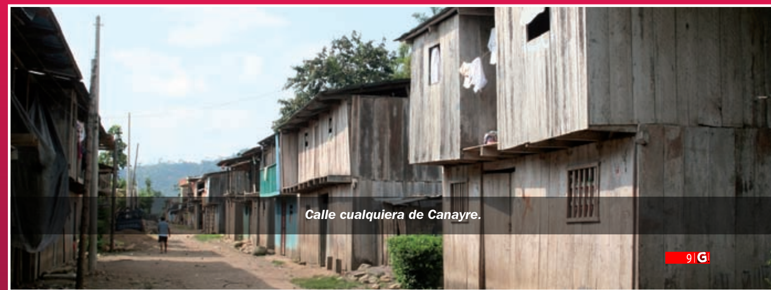
Calle cualquiera de Canayre.

En zonas como la selva, casi todas las enfermedades se dan por falta de servicios básicos sanitarios. No hay agua potable, solo entubada: agua de río almacenada en un pozo cavado en la tierra que se reparte a la población sin ningún tratamiento.