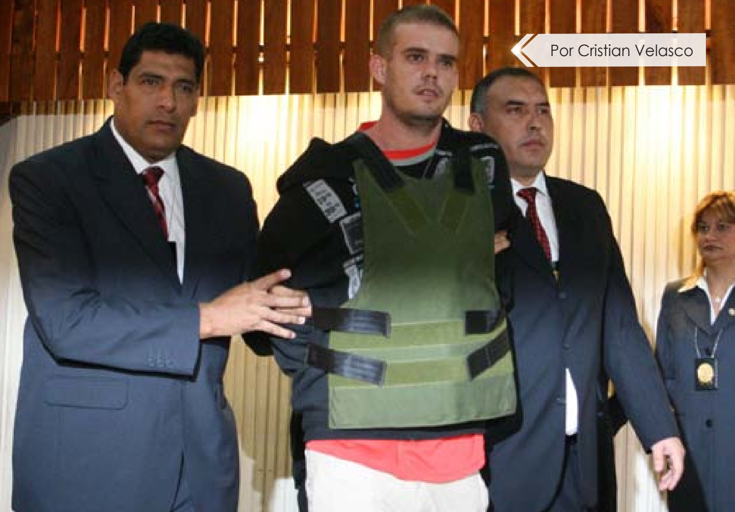
Por Cristian Velasco