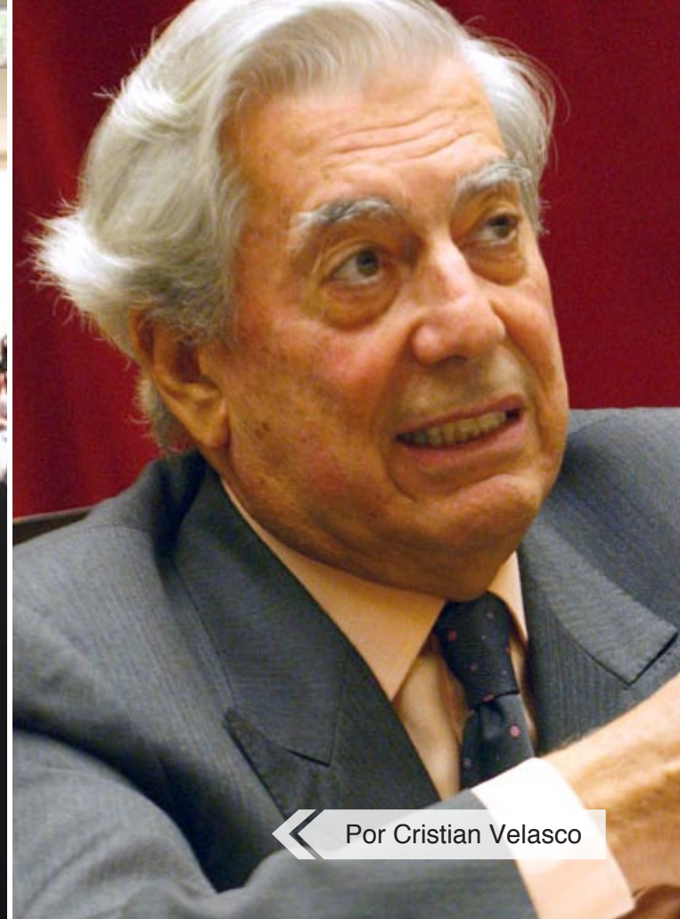
« Por Cristian Velasco