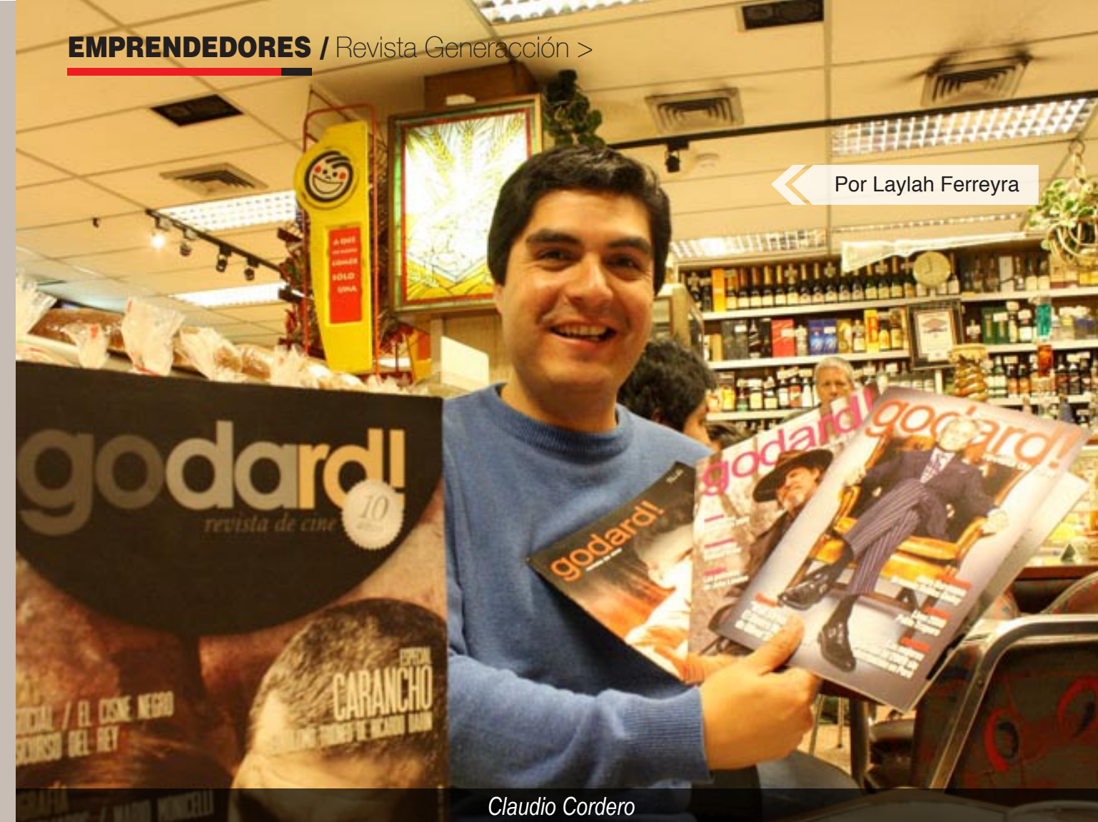
Por Laylah Ferreyra