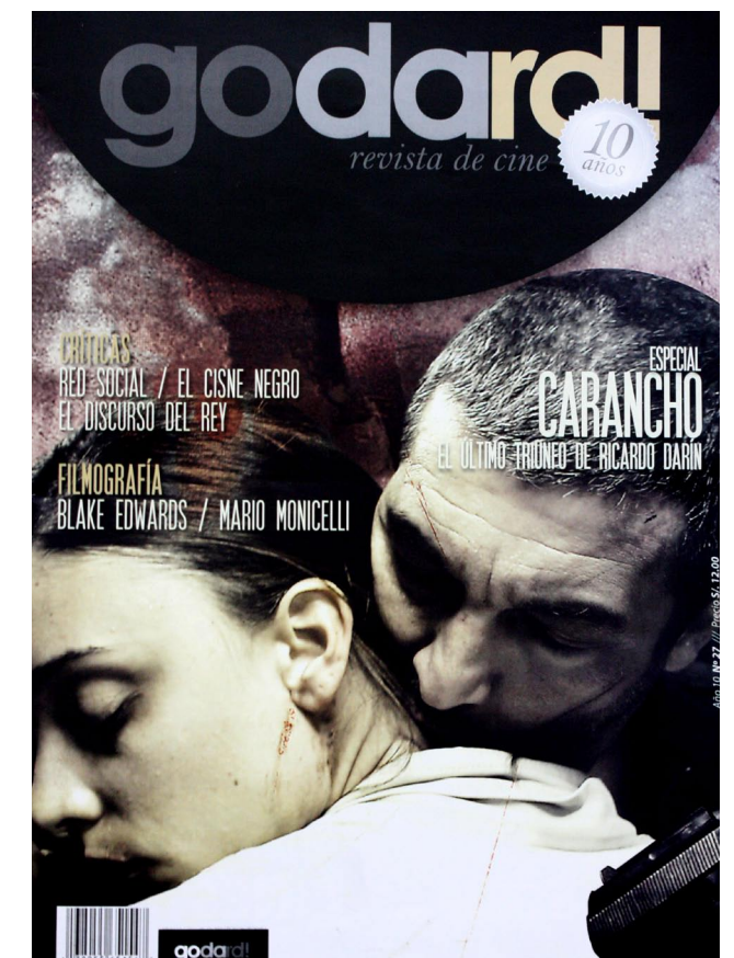
Última edición de Godard! (Marzo 2011)