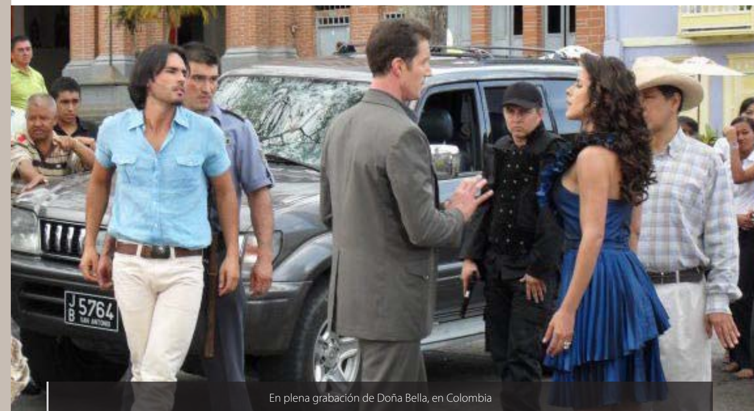
En plena grabación de Doña Bella, en Colombia