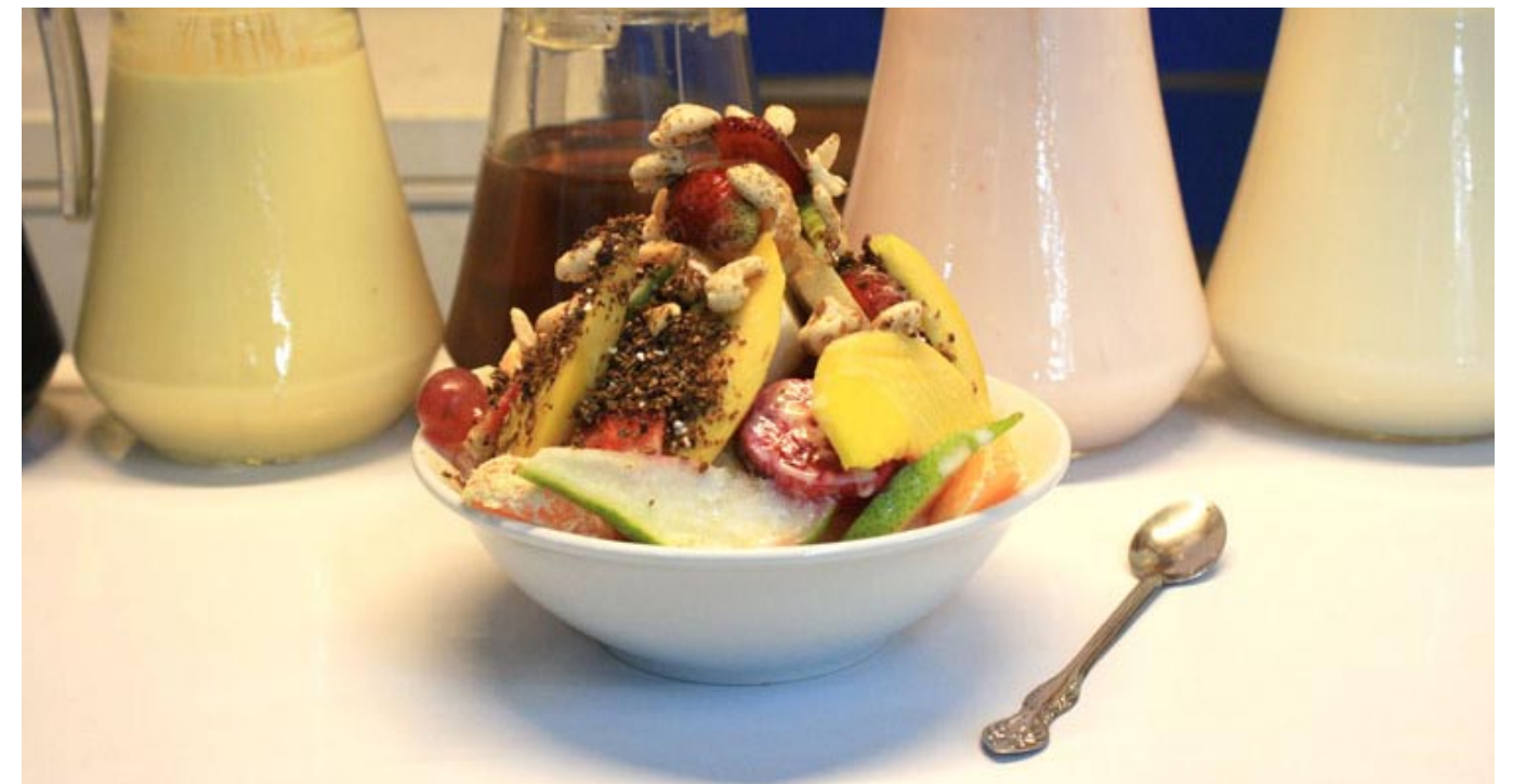
Entre los 3 nuevos soles y 50 céntimos, hasta los 5 soles, podemos crear nuestra ensalada de frutas con los sabores deseados.