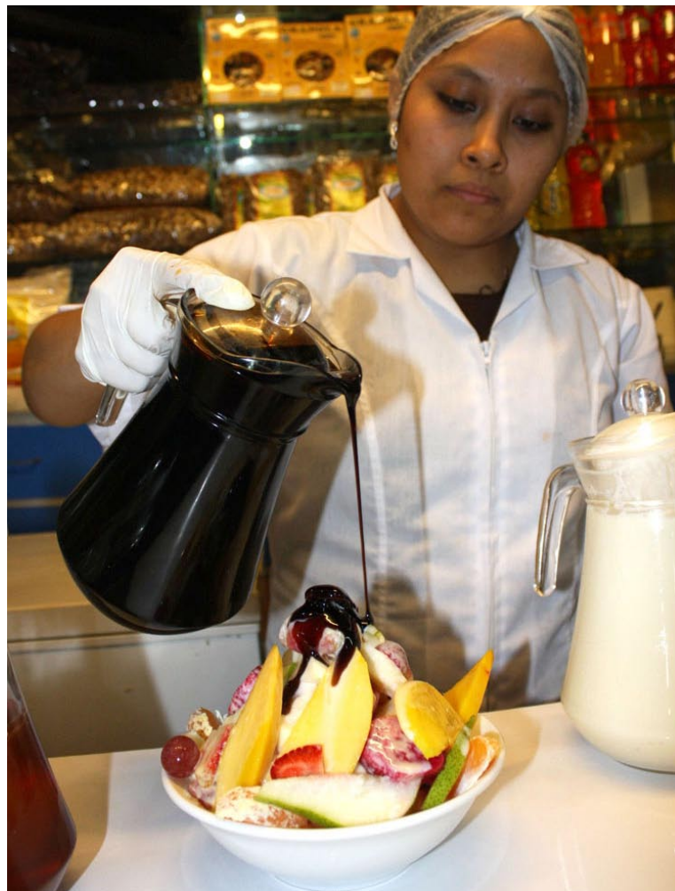
Un chorro de algarrobina piurana, imprime los nutrientes y la energía requeridos para hacer de este bocado, un alimento completo. Otra vez, la naturaleza demuestra que tiene lo suyo, para ser aprovechado en todas sus formas.