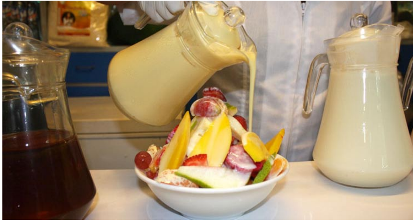
Con yogur de diversos sabores y a la elección del cliente, se bañan las frutas frescas, generosamente cortadas para el deleite de los comensales.