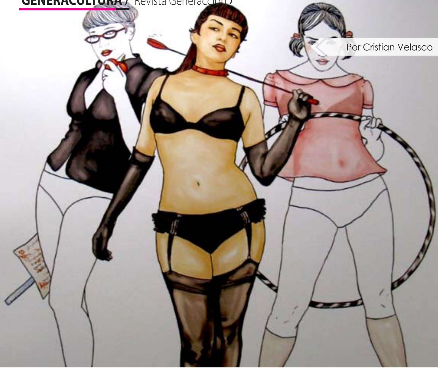
Por Cristian Velasco

de una pin-up limeña. Se muestra ligera de ropas en sus dibujos, pero sobre todo coqueta, fresca, atrevida, divertida y dispuesta a colarse en las fantasías de chicos y chicas.