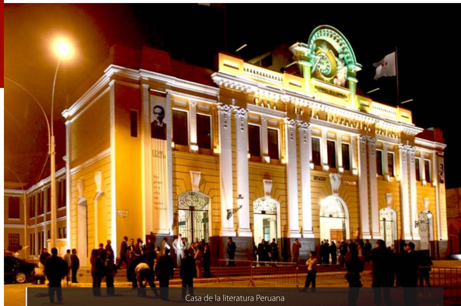
Casa de la literatura Peruana

“ En su niñez tuvo el enorme privilegio de tener como maestro al poeta César Vallejo, quien le enseñó a leer y escribir en el colegio San Juan ”