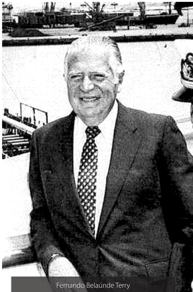
Fernando Belaúnde Terry

Además se presentan verdaderos tesoros editoriales, como las primeras ediciones de Los perros hambrientos (1939), Duelo de Caballeros (1963), Lázaro (1973) y ediciones de lujo y traducciones nunca antes vistas en nuestro país al chino, ruso, hebreo, polaco,