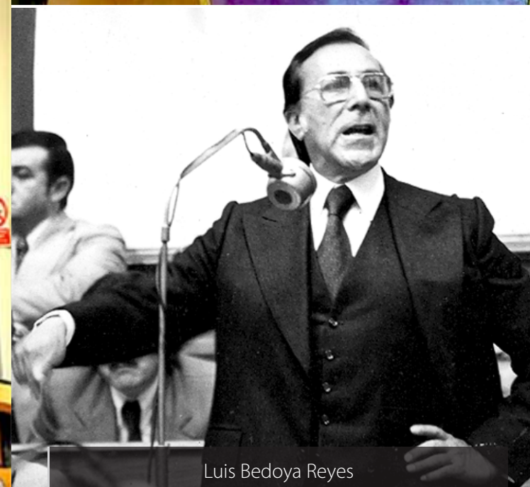
Luis Bedoya Reyes