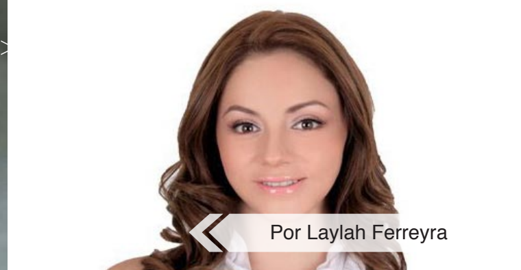
Por Laylah Ferreyra