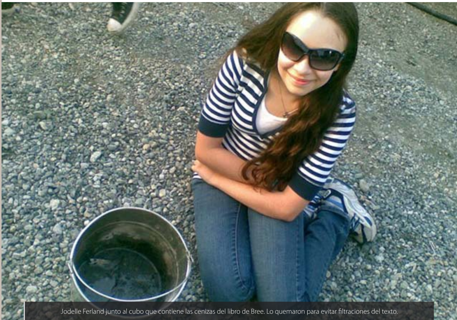
Jodelle Ferland junto al cubo que contiene las cenizas del libro de Bree. Lo quemaron para evitar filtraciones del texto.