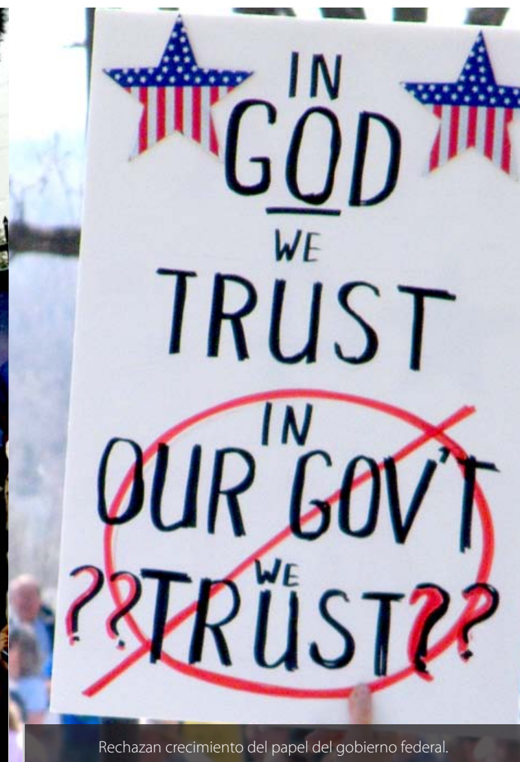
Rechazan crecimiento del papel del gobierno federal.