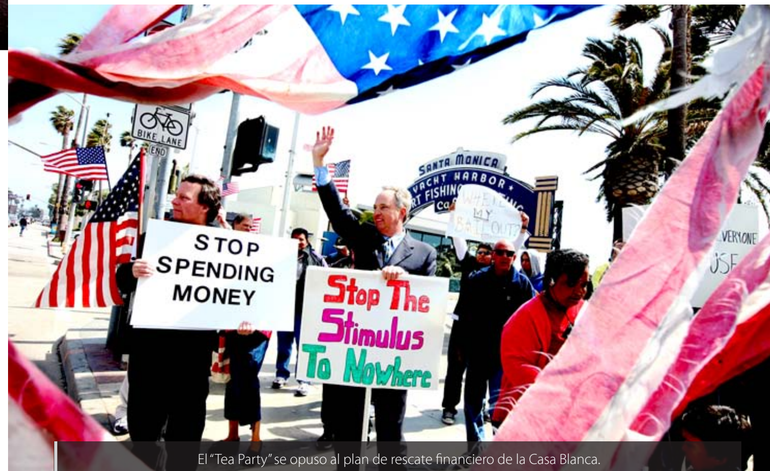
El “Tea Party” se opuso al plan de rescate financiero de la Casa Blanca.

Obama pasó a convertirse, según los más radicales, en un “comunista encubierto” y principal enemigo de las libertades individuales.