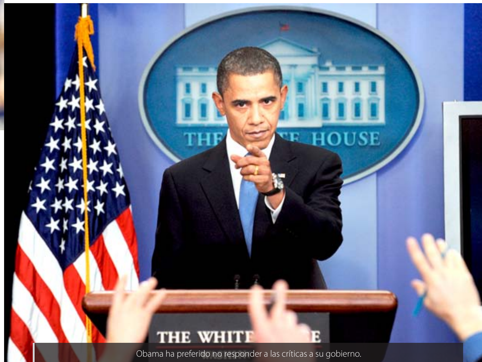
Obama ha preferido no responder a las críticas a su gobierno.

“ El "Tea Party", podría terminar captando a los sectores más radicales del conservadurismo norteamericano con la misión de realizar el trabajo sucio que no pueden hacer directamente los republicanos ”