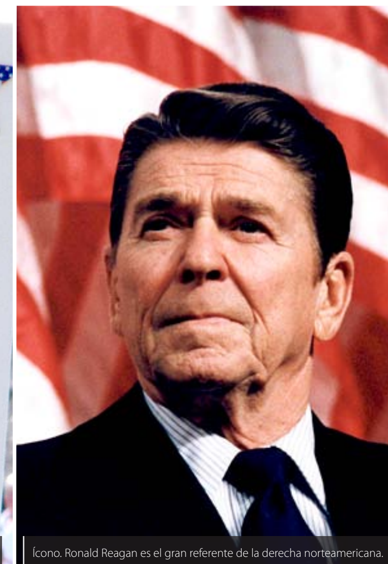
Ícono. Ronald Reagan es el gran referente de la derecha norteamericana.

ción americana y ensalzó la naturaleza anárquica, espontánea y descentralizada del “Tea Party”.