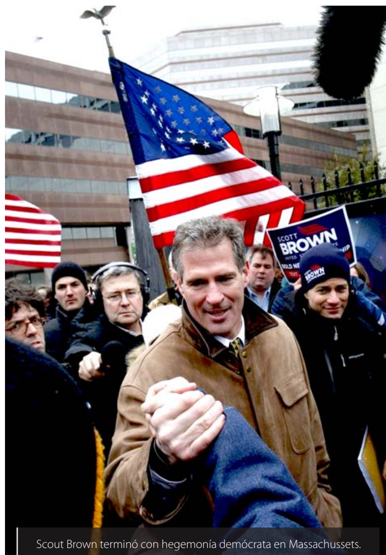
Scott Brown terminó con hegemonía demócrata en Massachussets.

Con esa sonrisa de Miss América y su estilo campechano que la han hecho tan popular entre los estadounidenses, Palin declaró inminente una nueva revolu-