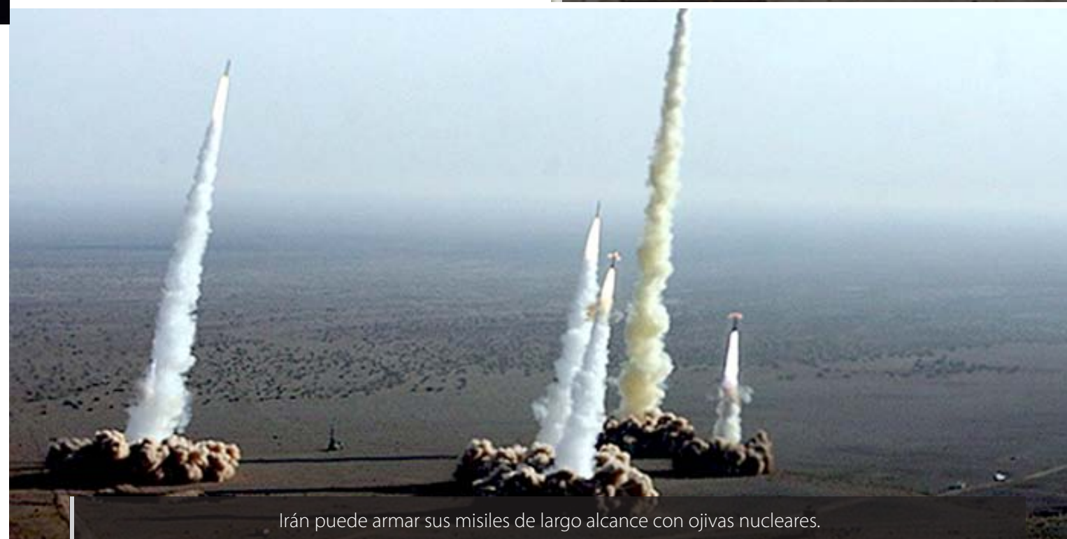
Irán puede armar sus misiles de largo alcance con ojivas nucleares.