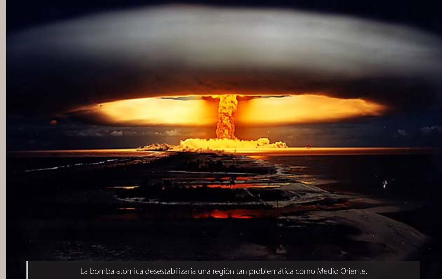
La bomba atómica desestabilizaría una región tan problemática como Medio Oriente.

Intensifica producción de uranio enriquecido