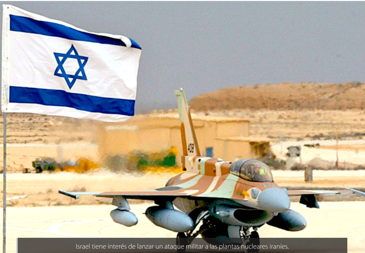
Israel tiene interés de lanzar un ataque militar a las plantas nucleares iraníes.

Irán comparte fronteras con Iraq y Afganistán, dos países en los que EE.UU. tiene una importante fuerza militar de ocupación y que son ejes de su guerra contra el terrorismo mundial.