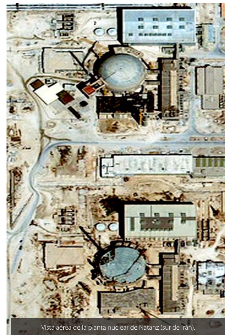
Vista aérea de la planta nuclear de Natanz (sur de Irán).

Y no son temores vagos, como dicen algunos escépticos. Un informe del Organismo Internacional de Energía Atómica (OIEA), filtrado por la prensa, reveló los temores de la ONU de que los iraníes estén fabricando una bomba nuclear.