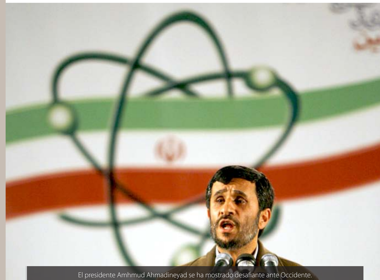
El presidente Amhmud Ahmadineyad se ha mostrado desafiante ante Occidente.

Según el OIEA, Irán ha obstaculizado el trabajo de los inspectores internacionales a los que les ha impedido su ingreso a algunas plantas donde se sospecha que hay material radioactivo prohibido.