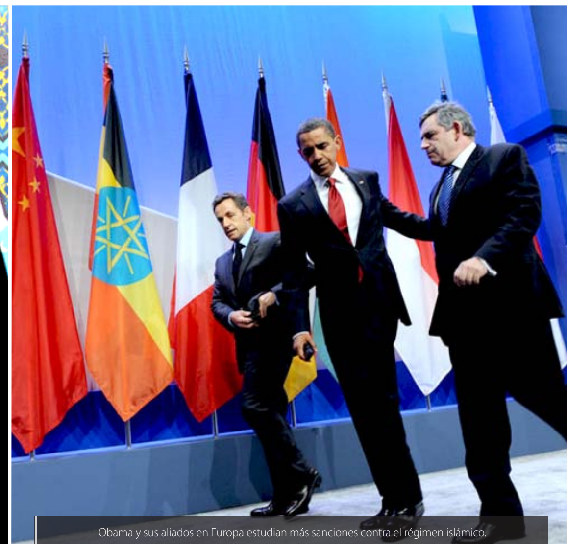
Obama y sus aliados en Europa estudian más sanciones contra el régimen islámico.

“ Irán cuenta con aviones de última generación y baterías de defensa antiaérea que son un peligro en caso de una incursión extranjera ”