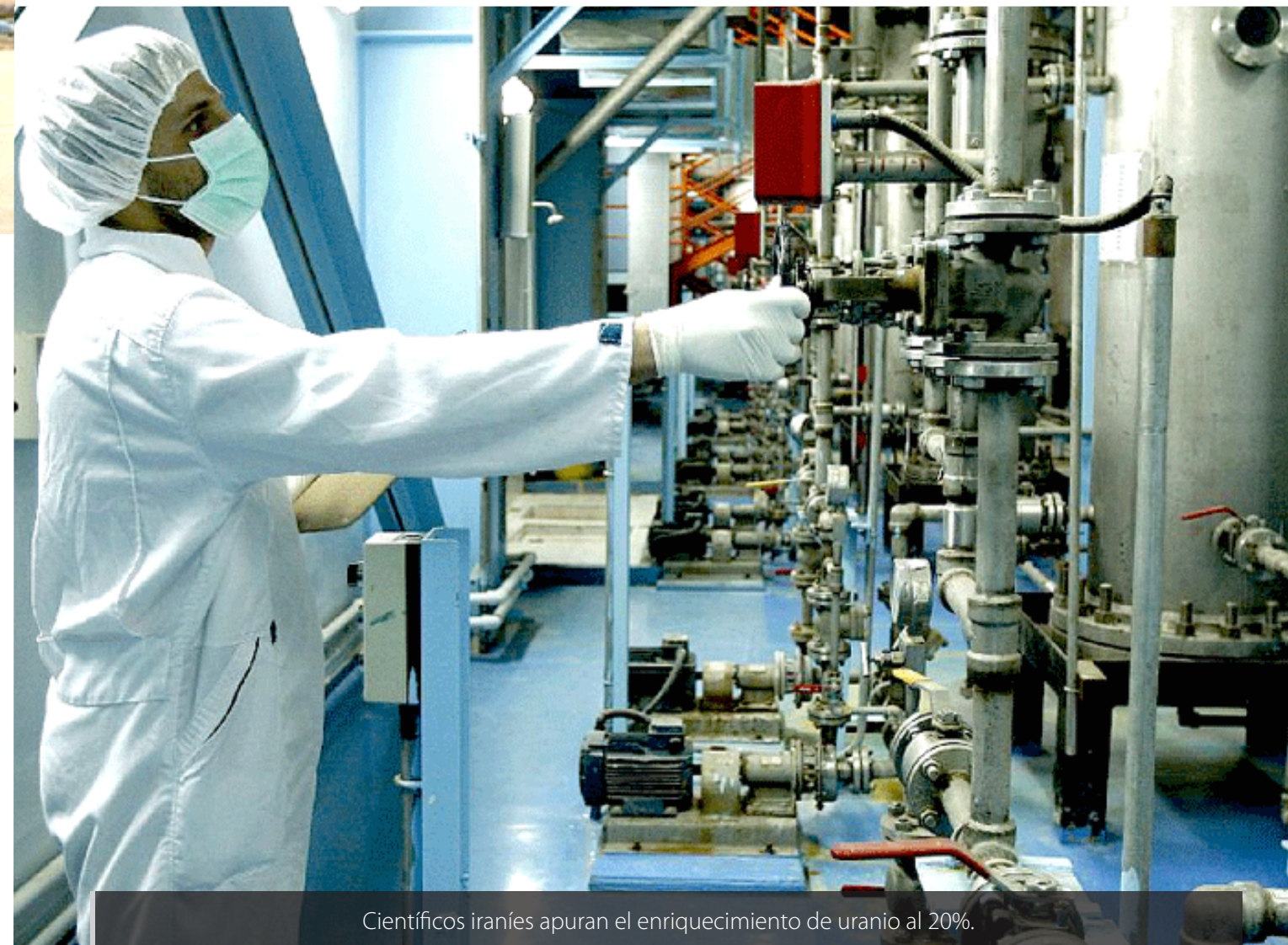
Científicos iraníes apuran el enriquecimiento de uranio al 20%.

No se puede decir que la gira de Clinton haya sido un fracaso, pero las respuestas que consiguió de los viejos aliados no han colmado sus expectativas.