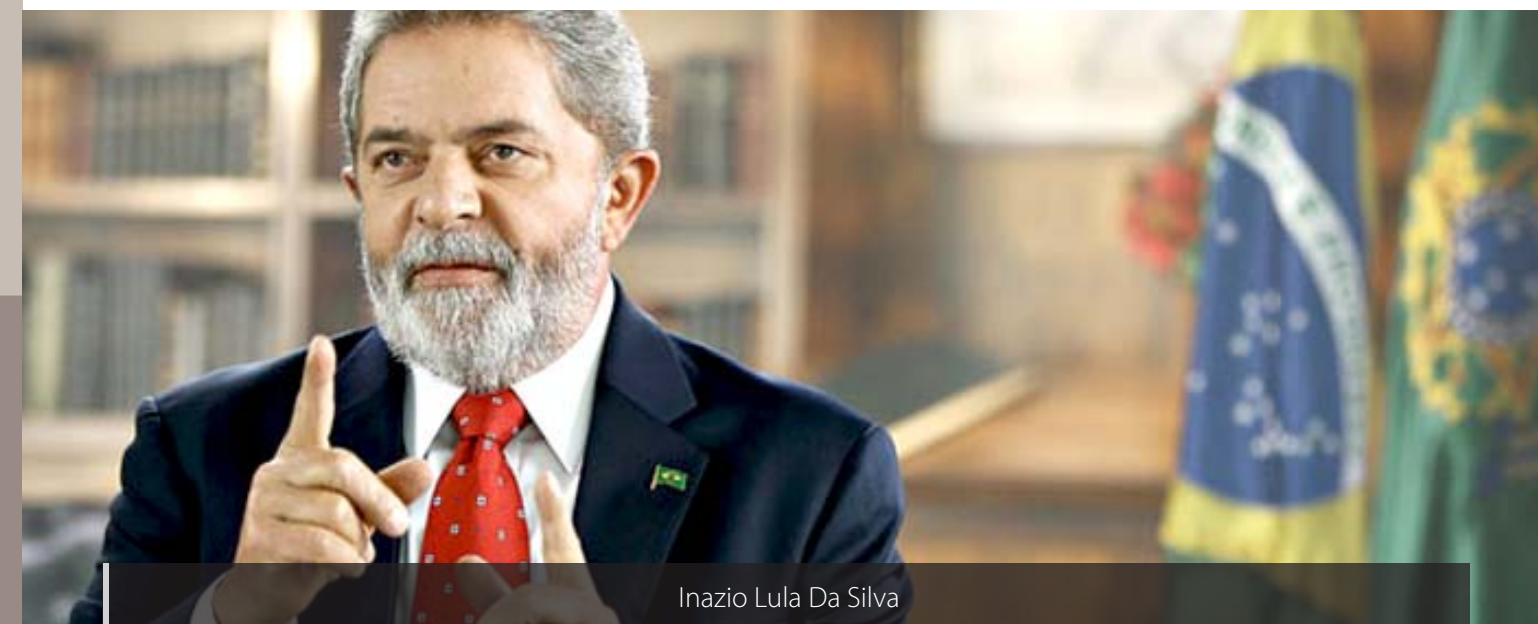
Inazio Lula Da Silva

Así más o menos es la sociedad del sur de Brasil vista por un peruano que a su vez consultó a brasileros y otros latinos que llegaron a esta zona. Los colombianos, argentinos o uruguayos que se quedaron por aquí tienen una idea más clara de lo que piensa el brasilero común y corriente. Incluso los pocos peruanos de Río Grande saben que no todo es color de rosa en el país de Ronaldinho Gaúcho, Felipeo y Dunga. ■