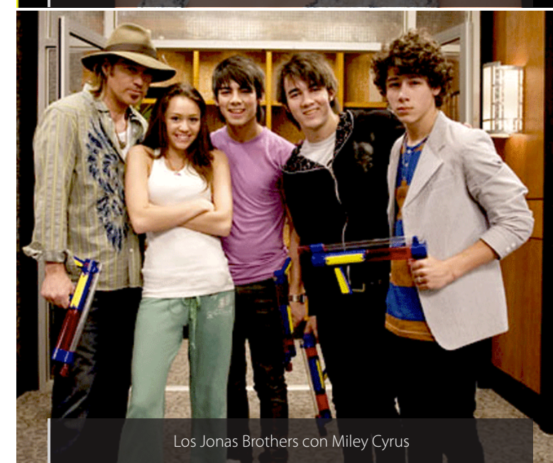
Los Jonas Brothers con Miley Cyrus