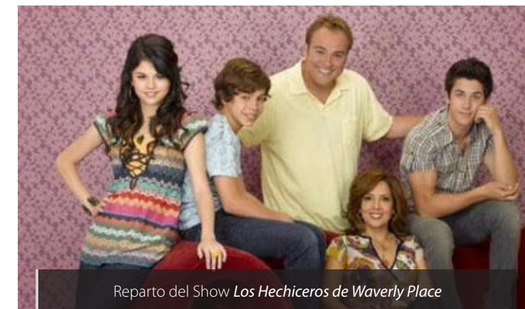
Reparto del Show Los Hechiceros de Waverly Place