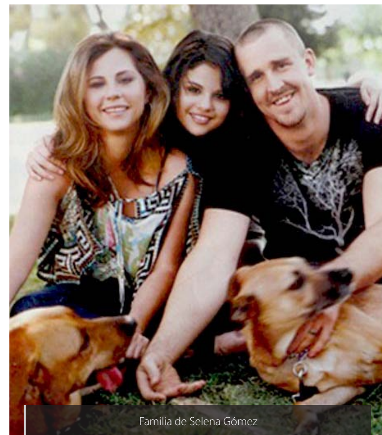
Familia de Selena Gómez

Sea por los rumores o estrategias de medios que emplean para estar siempre en boca de todos, los ídolos juveniles son seguidos con escrupulosa rigurosidad y esto lo aprovechan inteligentemente para producir más y más con ellos. En el caso de Selena, ella proyecta una imagen de chica perfectamente cuidada, a la moda,