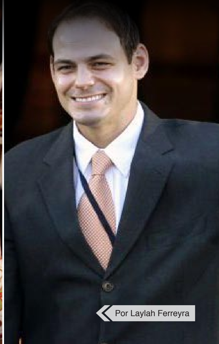
◀ Por Laylah Ferreyra