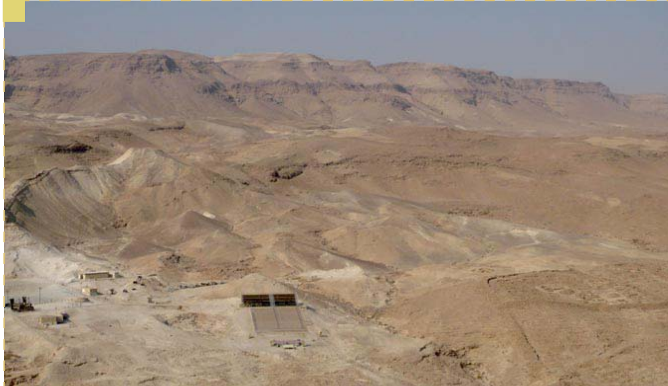
En la parte derecha se pueden ver los que fueron campamentos de los romanos. Aparecen en forma rectangular.