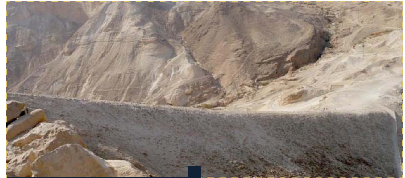
Se puede ver aún la rampa construida por los romanos para acceder a la fortaleza.