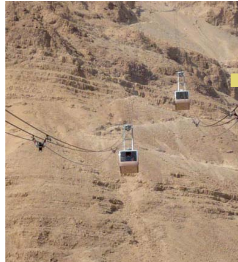
Teleféricos que llevan a los visitantes a las alturas de Masada.