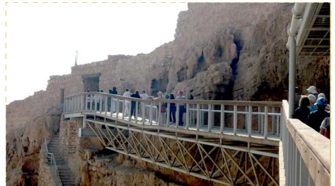
Rampas de acceso a la fortaleza.