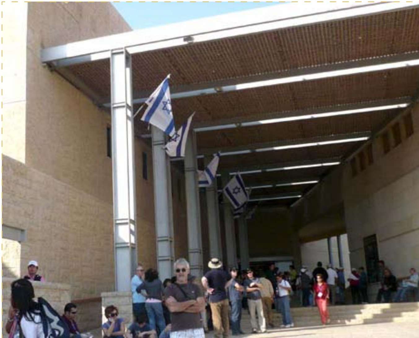
Parque Nacional de Masada.