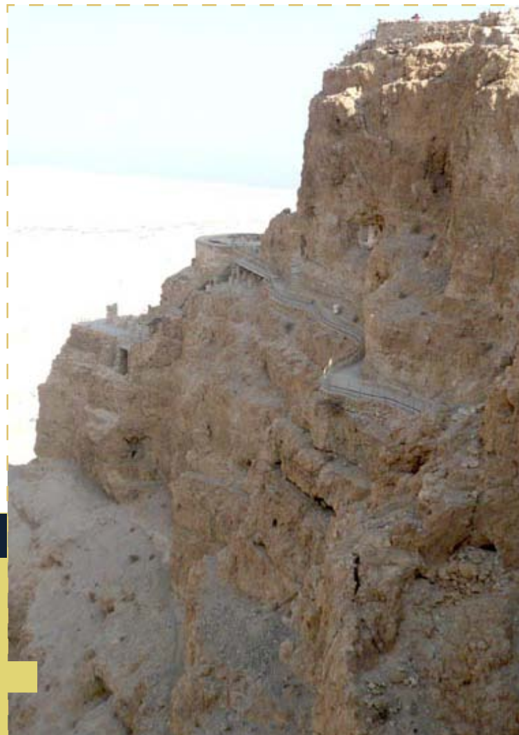
Canales construidos para filtrar el agua hasta el interior de la fortaleza. Se ven como pequeños agujeros en la roca.