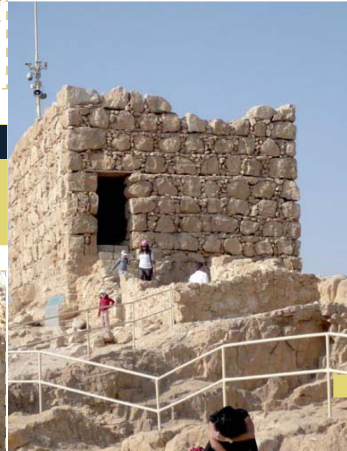
Antigua habitación que habría servido como lugar de vigilancia.