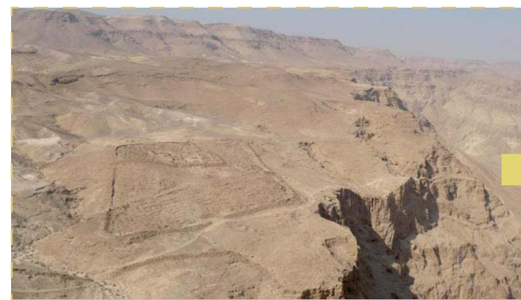
Mejor vista de un campamento romano.