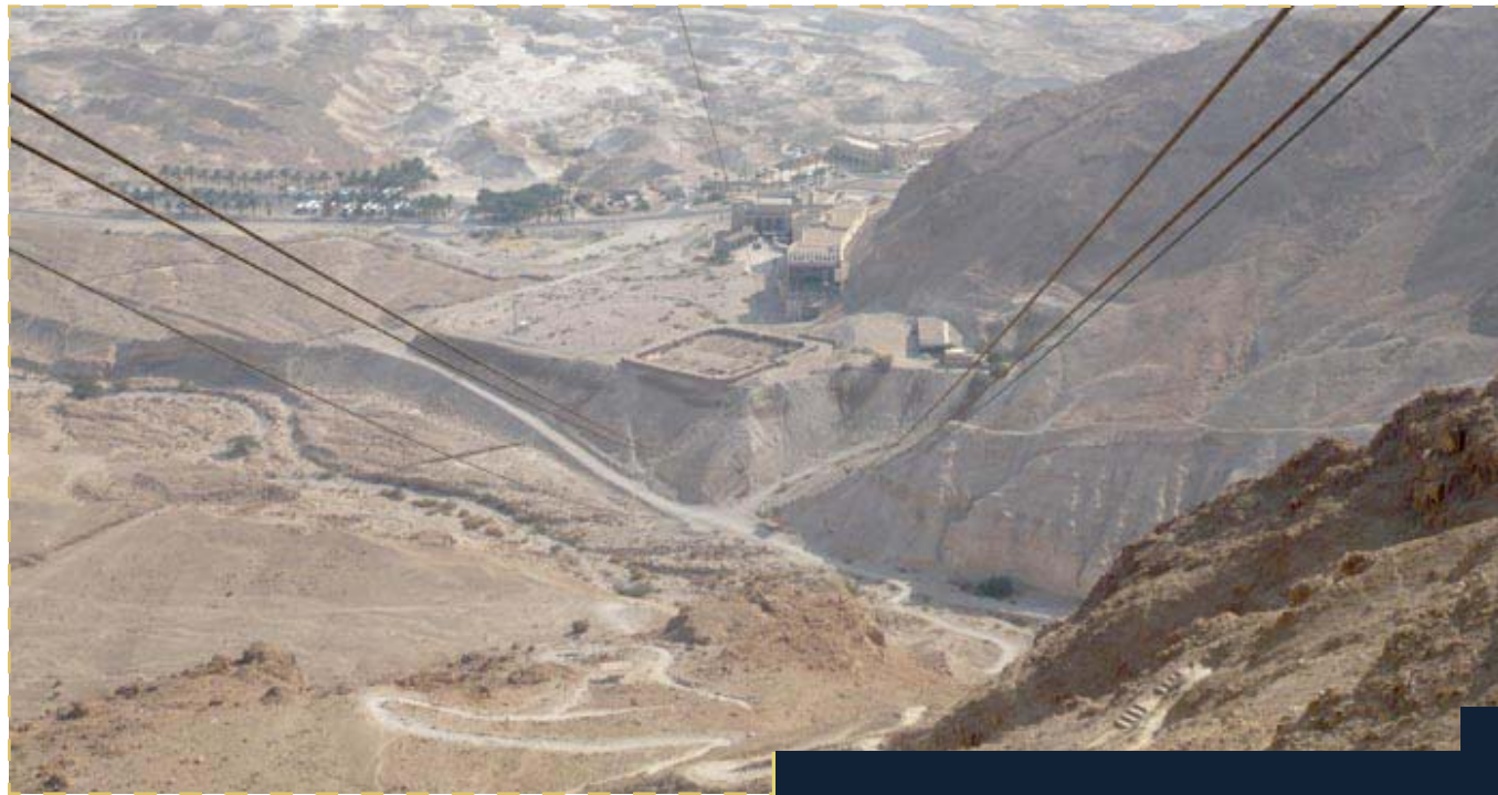
Camino que recorrían a pie los moradores de Masada. Conocido por su forma como el Camino de la Serpiente.