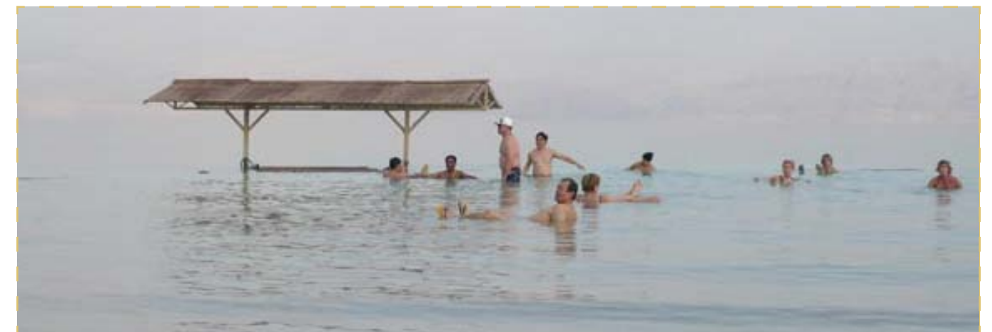
El Mar Muerto. Tiene tanta sal que no existe vida en él. La gente flota literalmente sin necesidad de flotador.