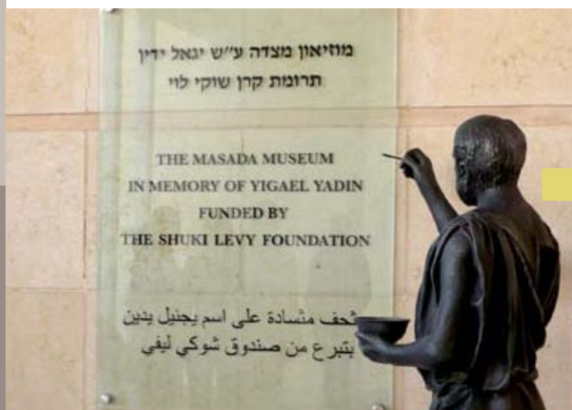
Placa de fundación del parque.