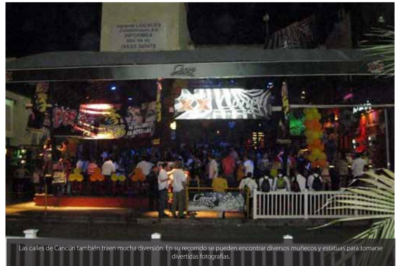
Las calles de Cancún también traen mucha diversión. En su recorrido se pueden encontrar diversos muñecos y estatuas para tomarse divertidas fotografías.