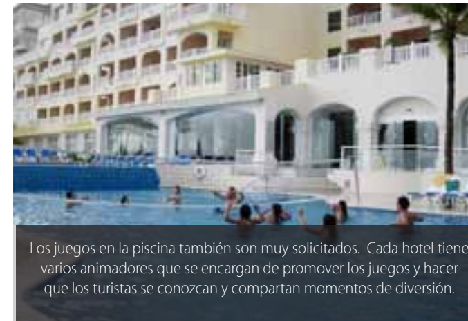
Los juegos en la piscina también son muy solicitados. Cada hotel tiene varios animadores que se encargan de promover los juegos y hacer que los turistas se conozcan y compartan momentos de diversión.