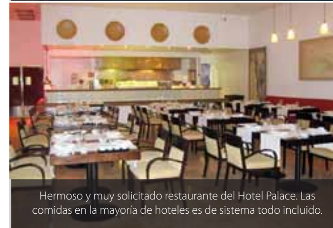
Hermoso y muy solicitado restaurante del Hotel Palace. Las comidas en la mayoría de hoteles es de sistema todo incluido.