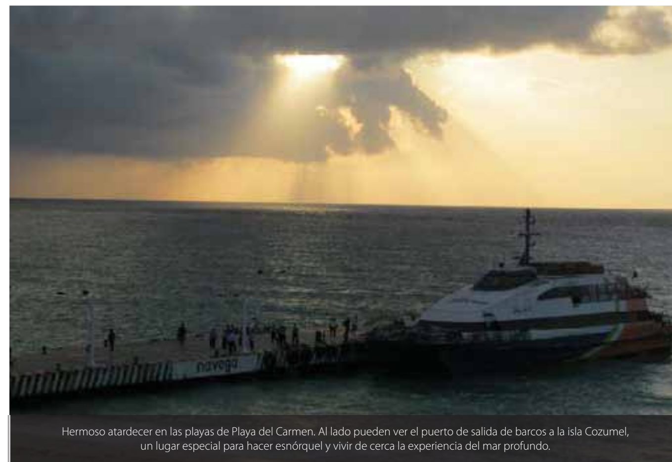
Hermoso atardecer en las playas de Playa del Carmen. Al lado pueden ver el puerto de salida de barcos a la isla Cozumel, un lugar especial para hacer esnórquel y vivir de cerca la experiencia del mar profundo.

→ G eneración estuvo en Cancún, ubicado en el estado de Quintana Roo en el sureste de México a más de 1,700 km de la ciudad de México y trae un reportaje fotográfico que terminará por convencerlo y empezar a alistar sus maletas para llegar a este maravilloso lugar.