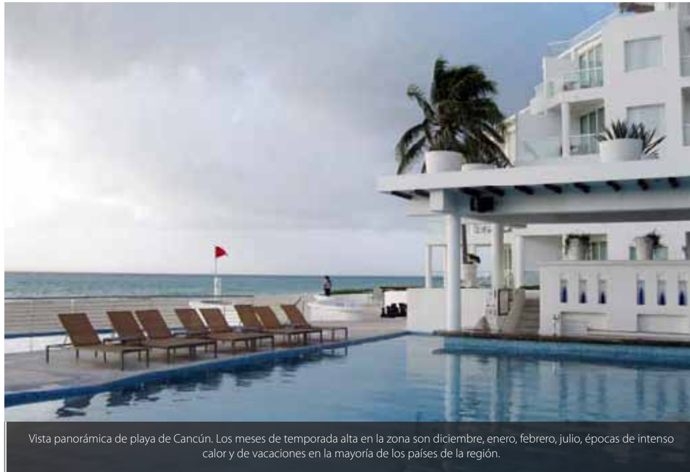
Vista panorámica de playa de Cancún. Los meses de temporada alta en la zona son diciembre, enero, febrero, julio, épocas de intenso calor y de vacaciones en la mayoría de los países de la región.