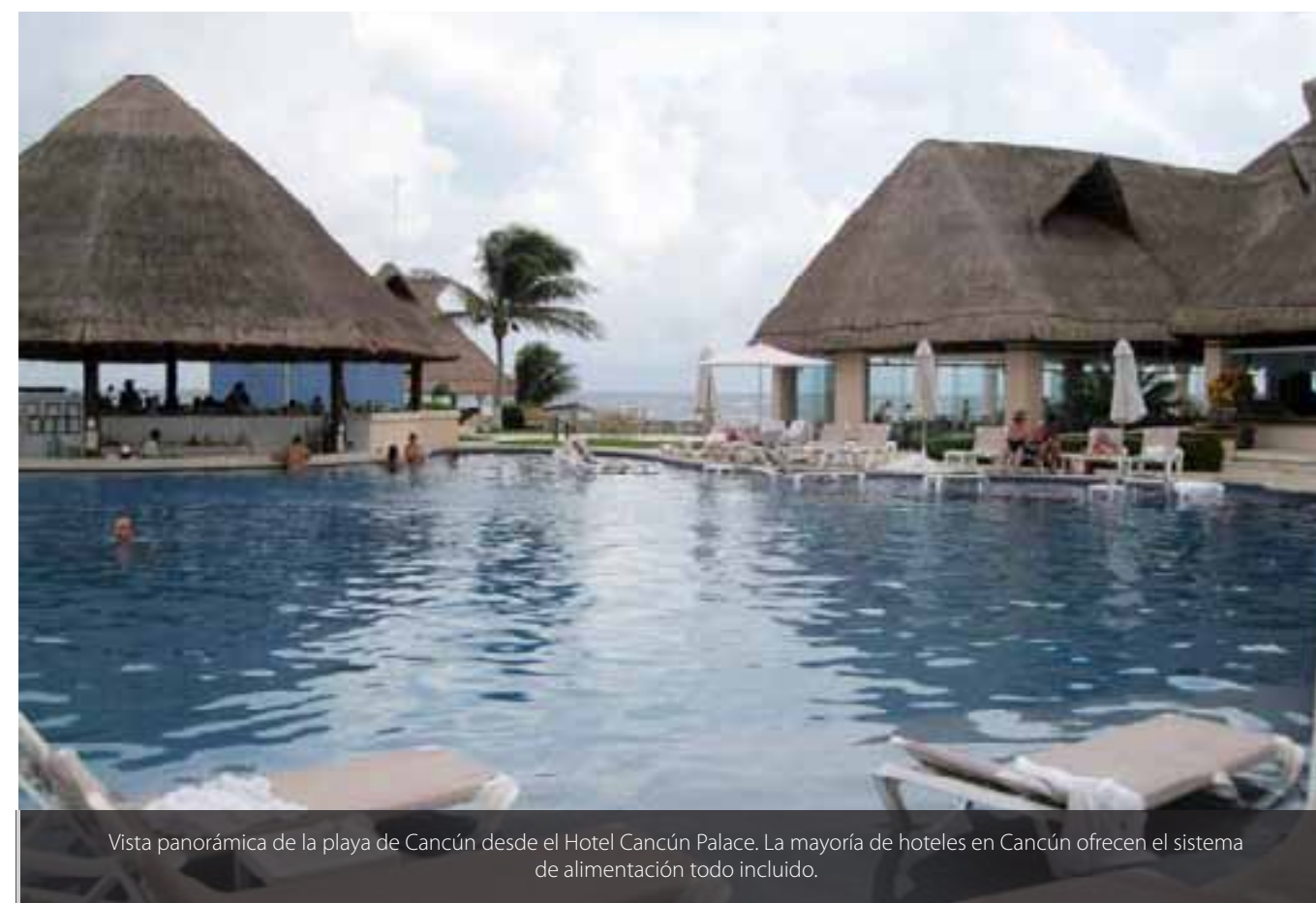
Vista panorámica de la playa de Cancún desde el Hotel Cancún Palace. La mayoría de hoteles en Cancún ofrecen el sistema de alimentación todo incluido.